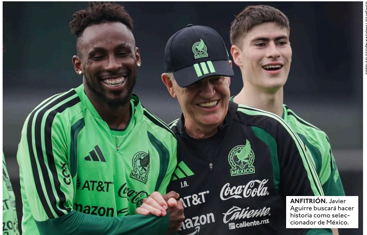
ANFITRIÓN. Javier Aguirre buscará hacer historia como seleccionador de México.

EL PORTERO MEXICANO DE 40 AÑOS ESTUVO PRESENTE EN EL MUNDIAL DE ALEMANIA 2006, SUDÁFRICA 2010, BRASIL 2014, RUSIA 2018 Y QATAR 2022.