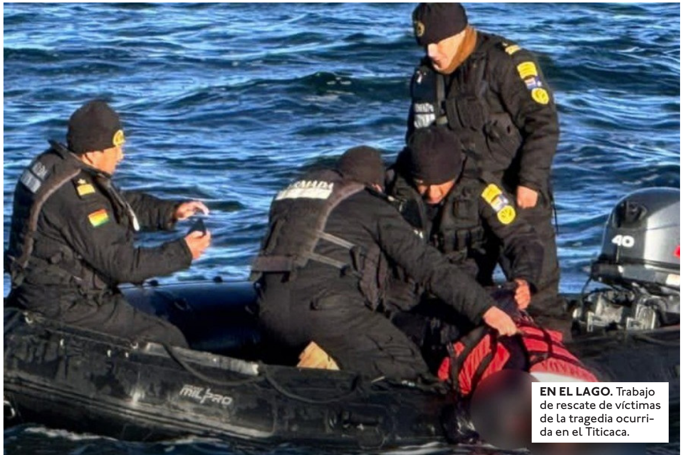
EN EL LAGO. Trabajo de rescate de víctimas de la tragedia ocurrida en el Titicaca.

LA ARMADA BOLIVIANA LOS EXHORTÓ A PRIORIZAR EL DIÁLOGO Y LA CONCERTACIÓN. ENFATIZÓ QUE EL LIBRE TRÁNSITO ES FUNDAMENTAL PARA EVITAR SITUACIONES DE RIESGO.