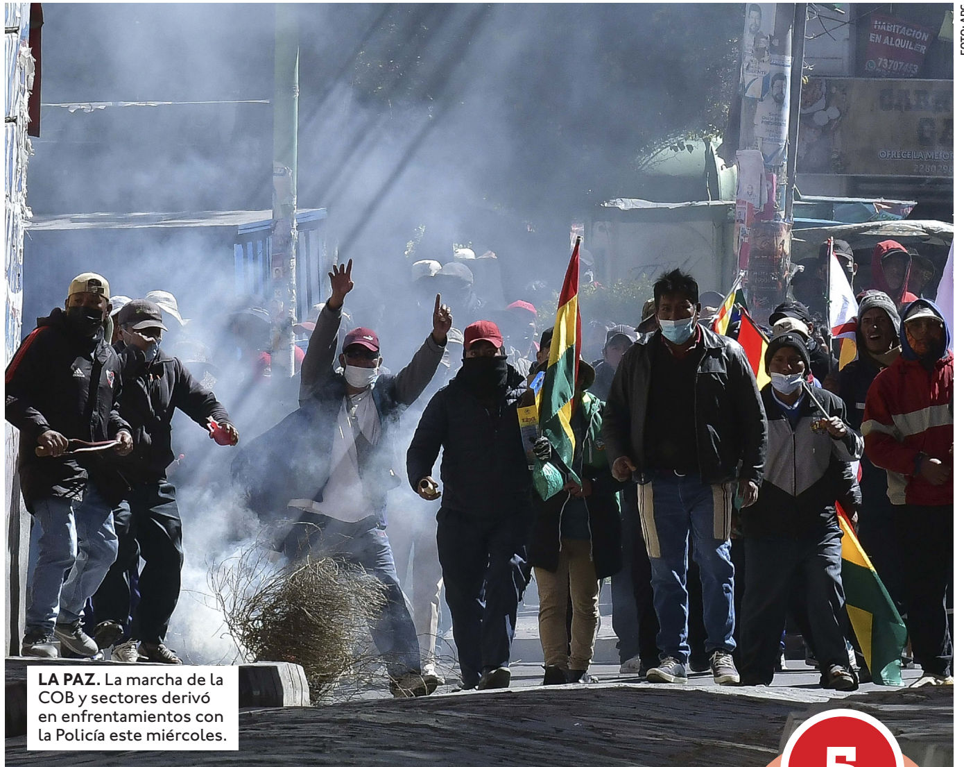
LA PAZ. La marcha de la COB y sectores derivó en enfrentamientos con la Policía este miércoles.

Enfatiza en advertir al narcoterrorismo. El presidente reafirmó este miércoles su llamado al diálogo para solucionar el conflicto que atraviesa Bolivia, sin embargo, enfatizó que no permitirá al narcoterrorismo en el país. "Lo que sí no voy a dejar pasar es al