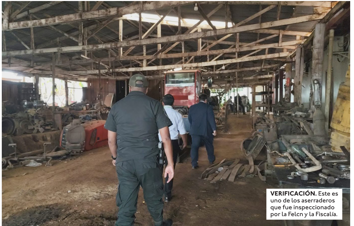
VERIFICACIÓN. Este es uno de los aserraderos que fue inspeccionado por la Felcn y la Fiscalía.

INTERNACIONAL PARA INVESTIGAR EL CASO, CON REPRESENTANTES DE LA POLICÍA DE ESPAÑA Y LA DEA, SEGÚN EL INFORME DEL MINISTRO DE GOBIERNO, MARCO ANTONIO OVIEDO.