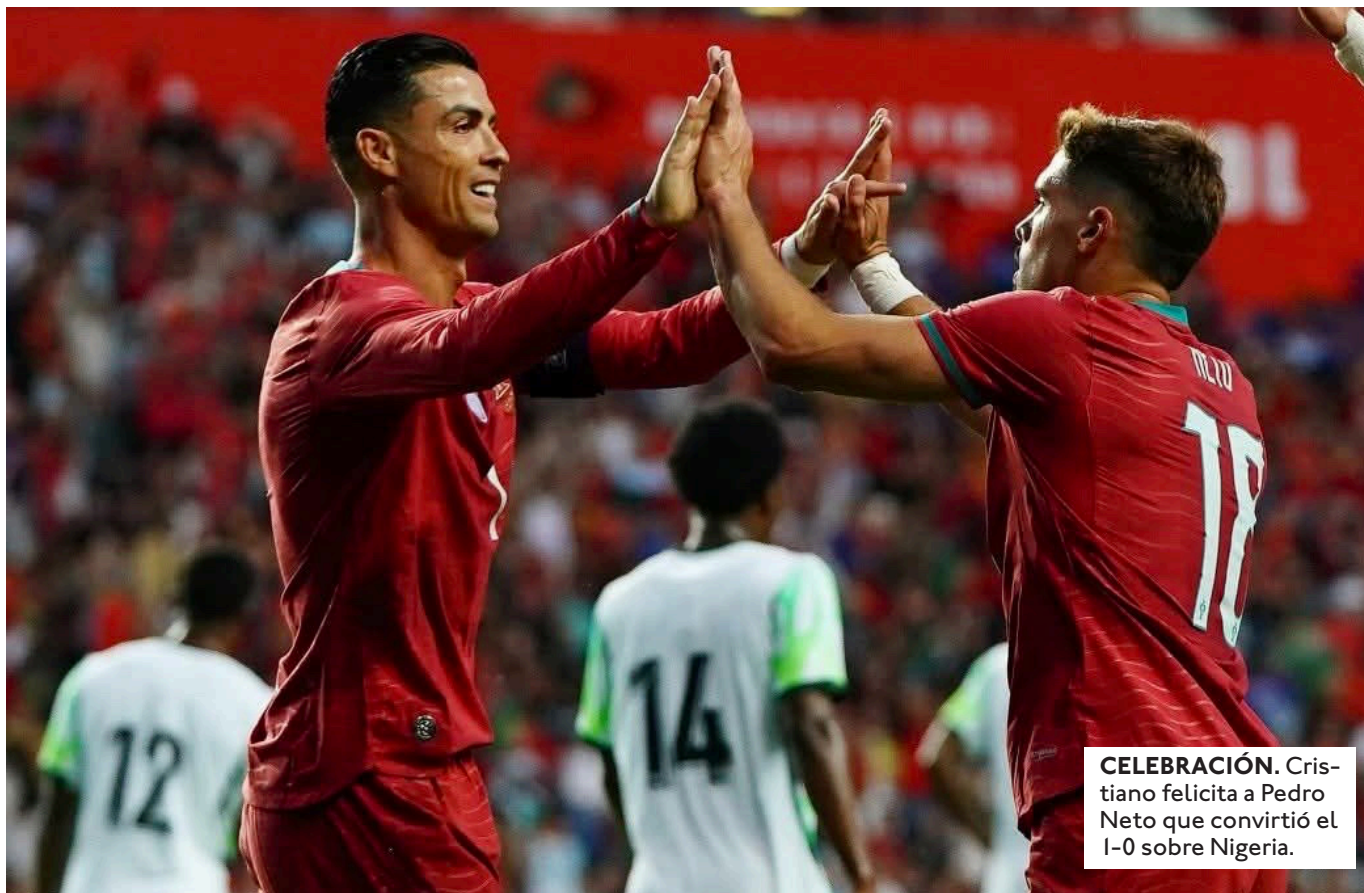
CELEBRACIÓN. Cristiano felicita a Pedro Neto que convirtió el 1-0 sobre Nigeria.

"VAMOS, MUCHACHOS. ES NUESTRO MOMENTO", ES LO QUE DICE EL DELANTERO DEL AL-NASSR EN UN VIDEO MOTIVACIONAL PUBLICADO POR PORTUGAL.