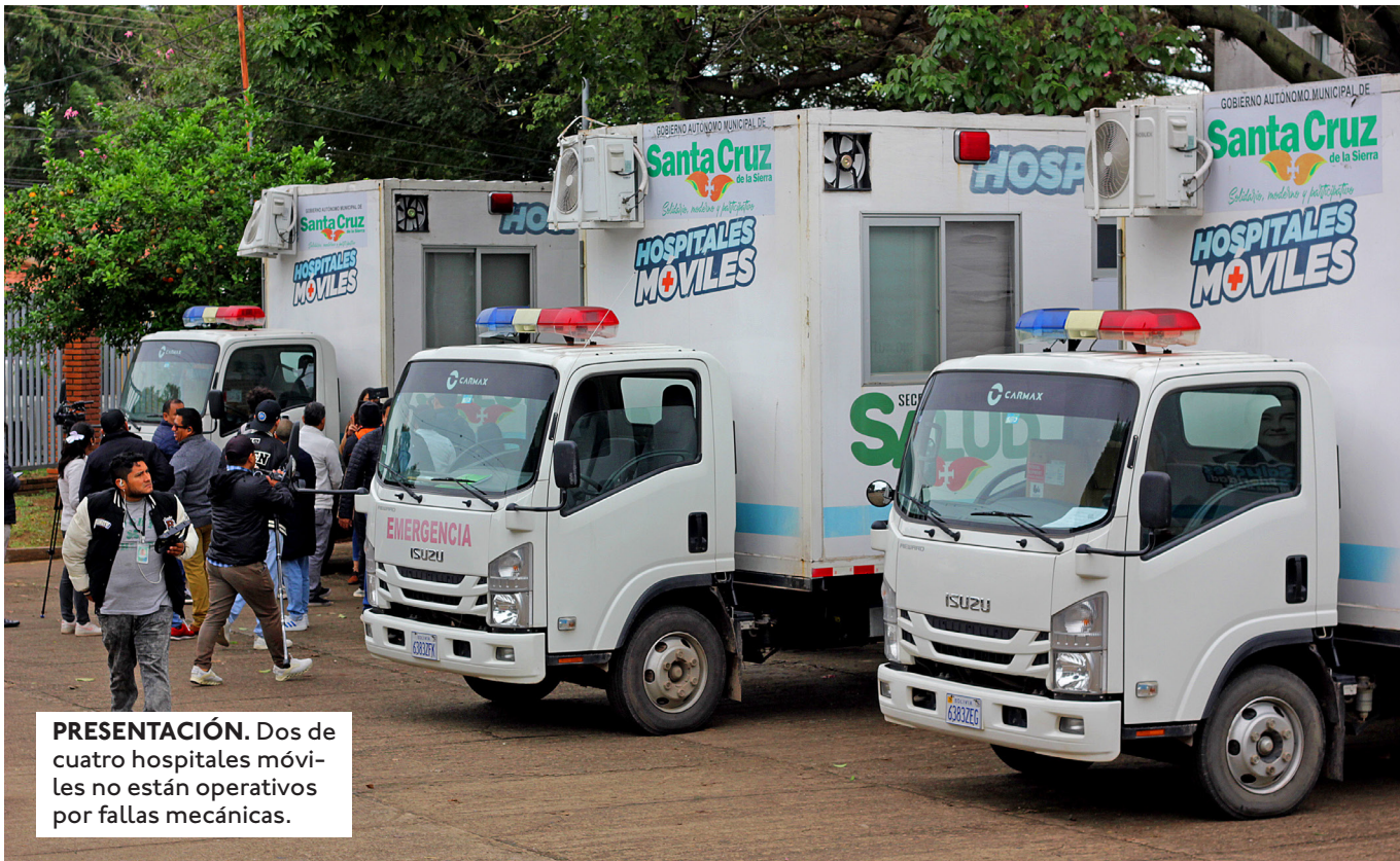
PRESENTACIÓN. Dos de cuatro hospitales móviles no están operativos por fallas mecánicas.

CONTRA EL EXDIRECTOR DE RECAUDACIONES DE LA ALCALDÍA, BORIS PEÑALOZA, POR EL PRESUNTO DELITO DE INCUMPLIMIENTO DE DEBERES EN EL COBRO DE IMPUESTOS.