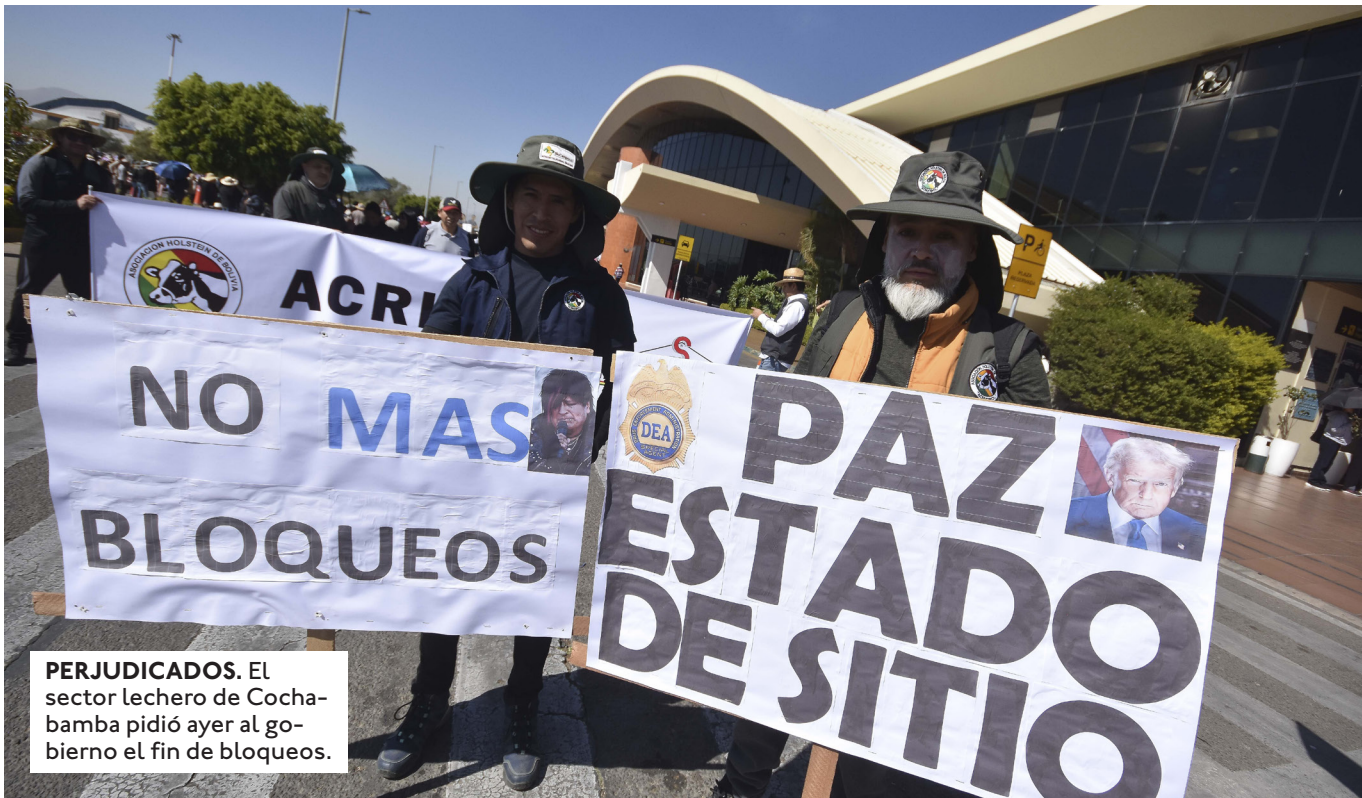
PERJUDICADOS. El sector lechero de Cochabamba pidió ayer al gobierno el fin de bloqueos.

LA ENTIDAD PIDIÓ QUE SE CONMINE AL GOBIERNO A GARANTIZAR CORREDORES HUMINTARIOS, ALLAR EL DIÁLOGO Y GARANTIZAR MECANISMOS DE ASISTENCIA MÉDICA Y ALIMENTARIA.