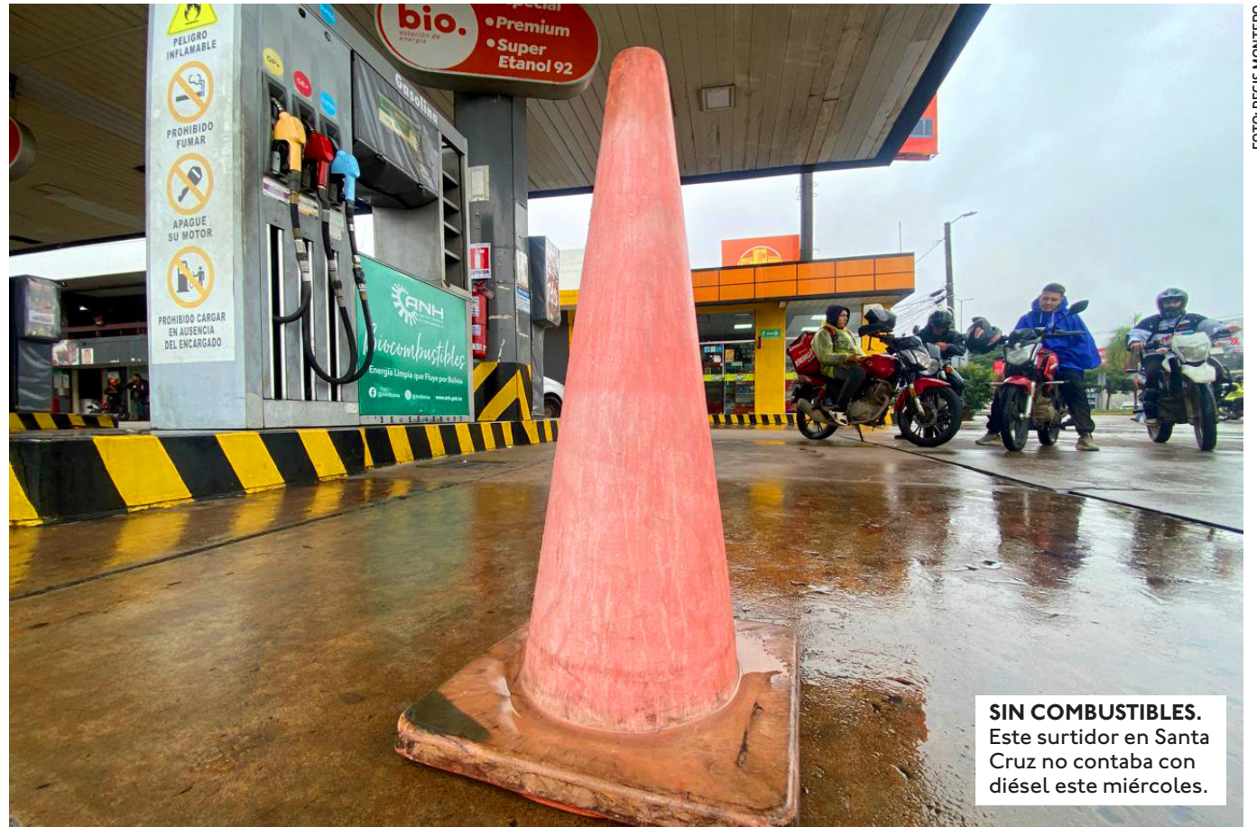
SIN COMBUSTIBLES. Este surtidor en Santa Cruz no contaba con diésel este miércoles.

EN ALGUNOS SURTIDORES LOS CONOS INDICABAN QUE NO CONTABAN CON DIÉSEL O GASOLINA Y EN OTROS HABÍA FILAS EN LA CAPITAL CRUCEÑA.