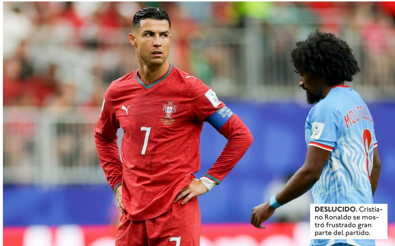
DESLUCIDO. Cristiano Ronaldo se mostró frustrado gran parte del partido.

A SUS 41 AÑOS Y 132 DÍAS, EL DELANTERO SE CONVIRTIÓ EN EL JUGADOR MÁS VETERANO EN SER TITULAR EN UN PARTIDO DE LOS MUNDIALES.