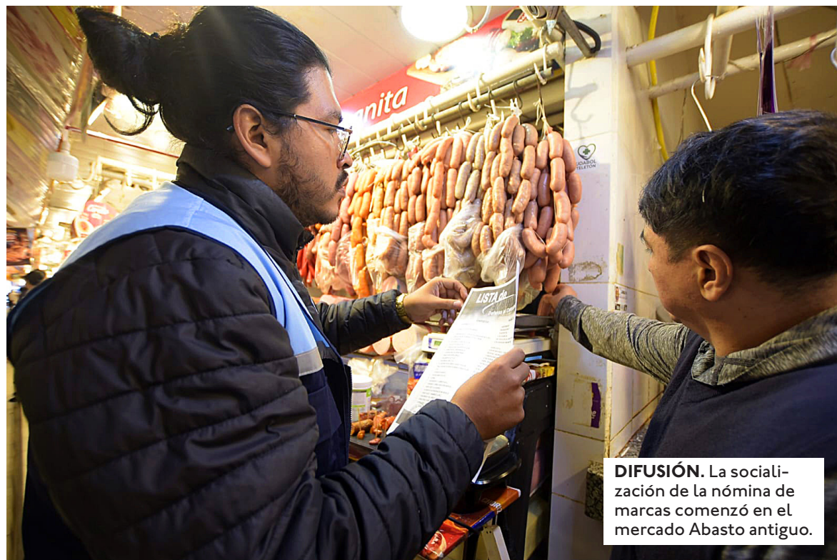
DIFUSIÓN. La socialización de la nómina de marcas comenzó en el mercado Abasto antiguo.