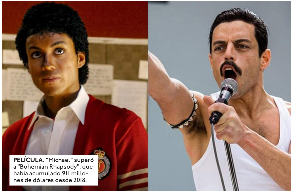
PELÍCULA. "Michael" superó a "Bohemian Rhapsody", que había acumulado 911 millones de dólares desde 2018.

El guion original, escrito por John Logan, contemplaba recrear la acusación de abuso presentada en 1993 por Jordan Chandler, de 13 años. Tras el descubrimiento del impedimento legal, la producción optó por acotar la trama al período comprendido entre 1966 y 1988, cinco años antes de que la primera denuncia pública contra el cantante se hiciera pública.