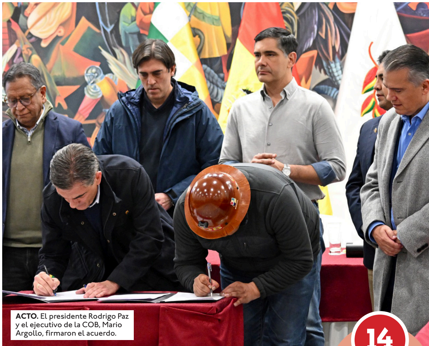
ACTO. El presidente Rodrigo Paz y el ejecutivo de la COB, Mario Argollo, firmaron el acuerdo.

Detalles del acuerdo. "A partir de este momento se están levantando las medidas de presión a nivel nacional con un compromiso del gobierno de cumplir de manera inmediata todo lo que se ha suscrito", señaló el ejecutivo de la COB. Agregó que la ejecución del acuerdo tiene un plazo definido de 90 días. Argollo agradeció el compromiso del ministro de Gobierno, Marco Oviedo, para la liberación de los detenidos durante las movilizaciones. Agregó que el próximo miércoles 24 de junio se instalarán mesas de trabajo para analizar las necesidades de cada sector. También pidió disculpas a los ciudadanos perjudicados por las medidas de presión, aunque resaltó que la lucha no fue en vano. Señaló que el compromiso incluye la protección de los recursos naturales y la socialización previa de los