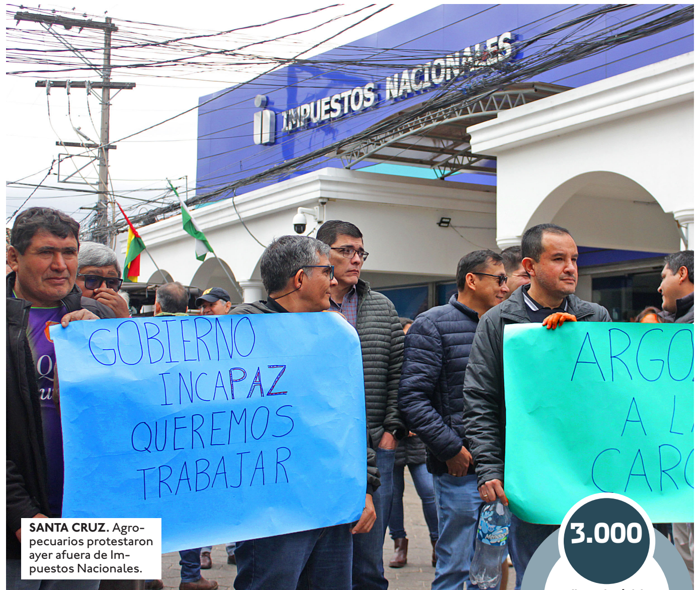
SANTA CRUZ. Agropecuarios protestaron ayer afuera de Impuestos Nacionales.

Agregó que después de provocar la quiebra de los sectores económicos, los mismos bloqueadores van a salir a exigir carne barata, pese a la destrucción que han causado en las cadenas productivas. "La inacción de este gobierno nos está llevando a la destrucción. Es