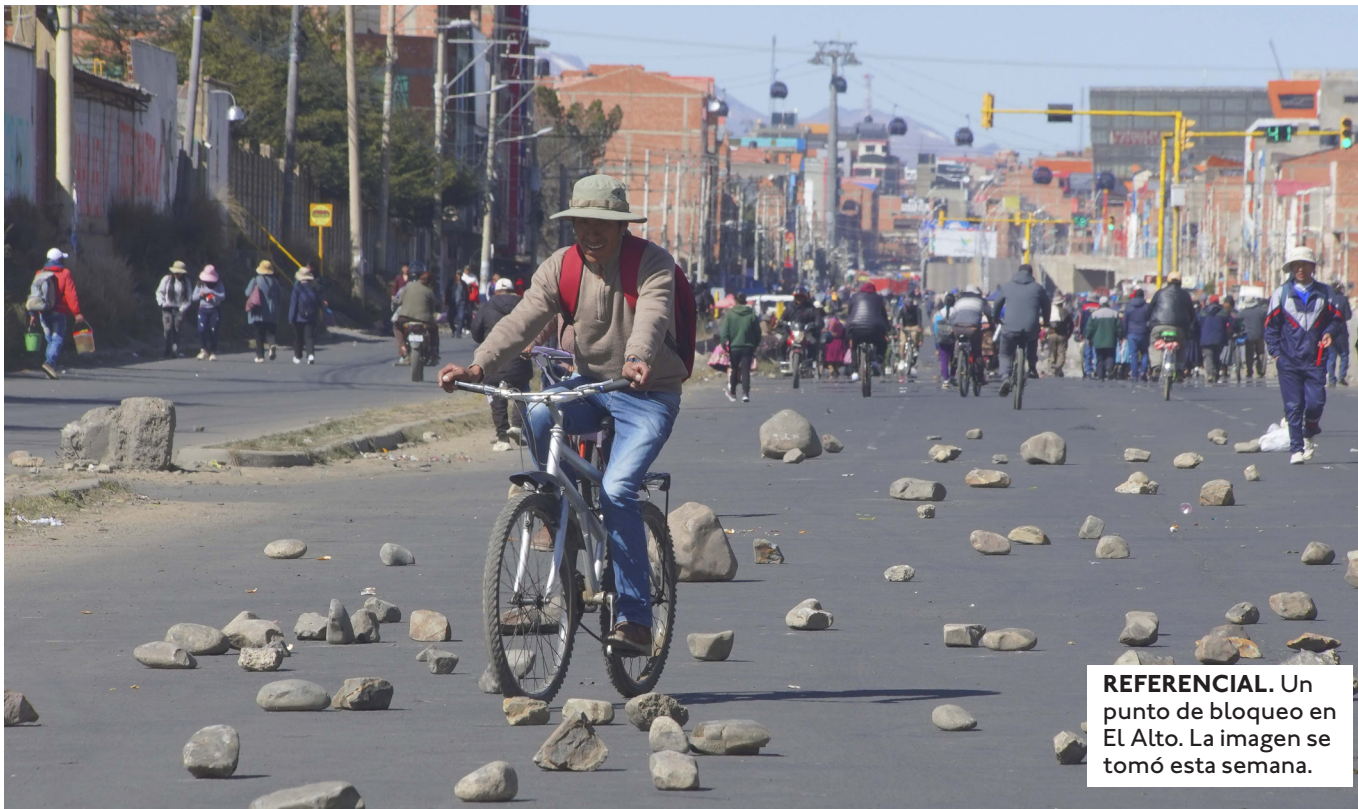
REFERENCIAL. Un punto de bloqueo en El Alto. La imagen se tomó esta semana.

EL DEFENSOR DEL PUEBLO PEDRO CALLISAYA SEÑALÓ QUE HAY UNA CRISIS DE REPRESENTATIVIDAD EN SECTORES SOCIALES Y ESO DIFICULTA EL DIÁLOGO.