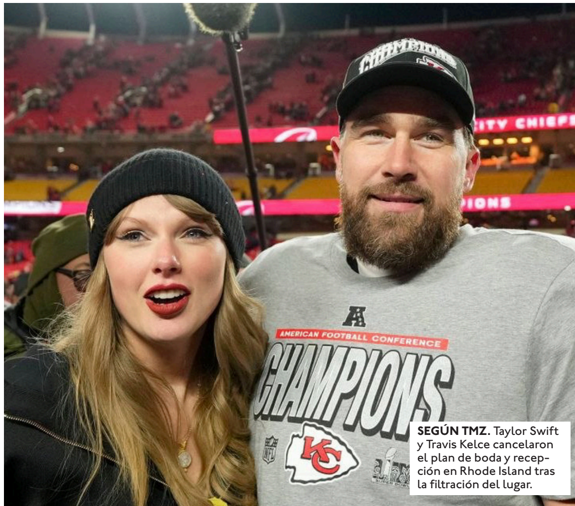
SEGÚN TMZ. Taylor Swift y Travis Kelce cancelaron el plan de boda y recepción en Rhode Island tras la filtración del lugar.

"Tenemos plena confianza en el trabajo del NYPD y de nuestros socios estatales para garantizar una experiencia segura", dijo Ma-