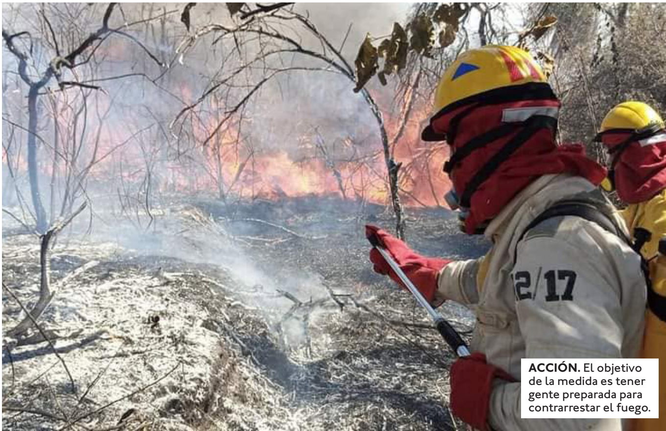
ACCIÓN. El objetivo de la medida es tener gente preparada para contrarrestar el fuego.

DE INCENDIOS FIGURAN EN EL INFORME: SAN IGNACIO DE VELASCO, SAN MATÍAS, ASCENSIÓN DE GUARAYOS, CONCEPCIÓN, SAN JUAN, URUBICHÁ Y SAN RAFAEL.