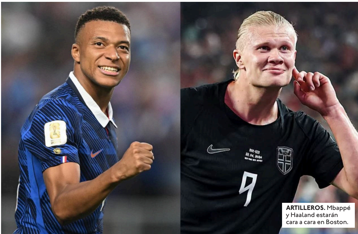
ARTILLEROS. Mbappé y Haaland estarán cara a cara en Boston.

EL SELECCIONADO SENEGALÉS DEBE GOLEAR PARA SUMAR 3 PUNTOS Y ESPERAR CLASIFICAR COMO UNO DE LOS MEJORES TERCEROS.