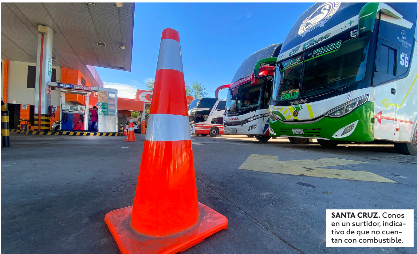
SANTA CRUZ. Conos en un surtidor, indicativo de que no cuentan con combustible.

EL MINISTRO JOSÉ GABRIEL ESPINOZA REMARCÓ QUE EL GOBIERNO CUENTA CON LOS RECURSOS ECONÓMICOS SUFICIENTES PARA IMPORTAR COMBUSTIBLES. NEGÓ ASÍ QUE ESTE SEA UN FACTOR.