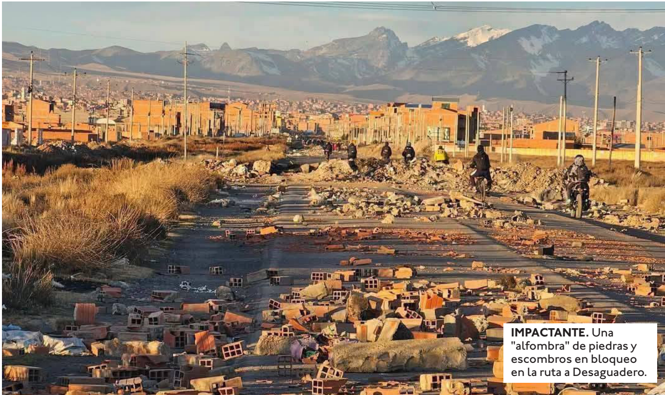
IMPACTANTE. Una "alfombra" de piedras y escombros en bloqueo en la ruta a Desaguadero.

TRAS EL ACUERDO FIRMADO HACE UNA SEMANA SE FIJÓ PARA ESTE 24 DE JUNIO LA INSTALACIÓN DE MESAS DE TRABAJO CON EL GOBIERNO, PERO NO HUBO NOVEDADES AL RESPECTO.