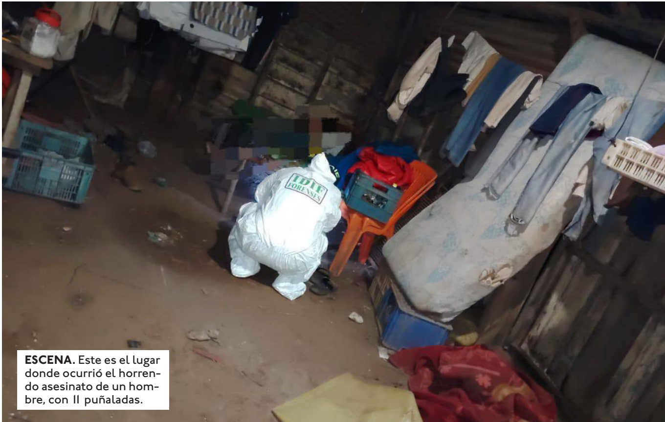
ESCENA. Este es el lugar donde ocurrió el horrendo asesinato de un hombre, con 11 puñaladas.

EL INFORME FORENSE ESTABLECE QUE EL HOMBRE ASESINADO PRESENTABA ALGUNAS HERIDAS EN EL CUELLO, QUE PROVOCARON LA PÉRDIDA DE SANGRE.