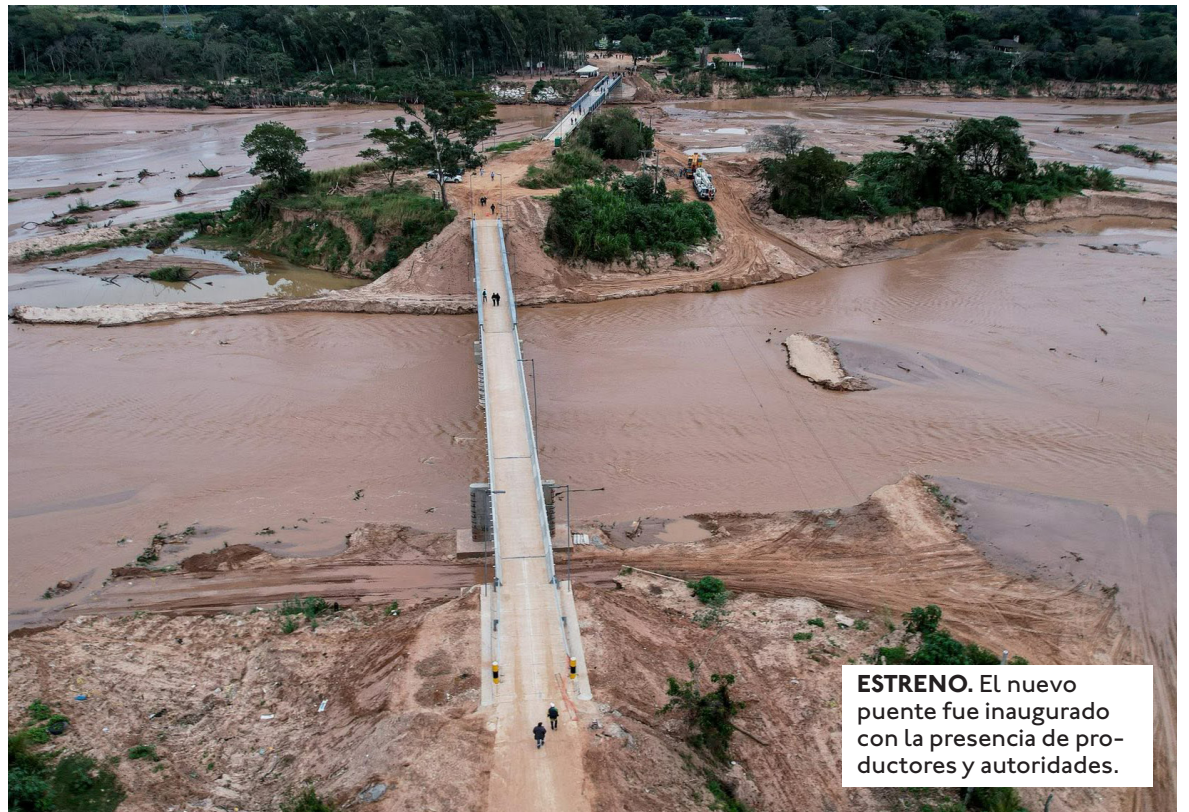
ESTRENO. El nuevo puente fue inaugurado con la presencia de productores y autoridades.

Zona de heladas. Respecto a las recientes nevadas y heladas, dijo que se registraron principalmente en las zonas altas de Pucará, Postrevalle y Moro Moro, donde cada año se presentan estos fenómenos climáticos, pero los daños aún no son significativos.