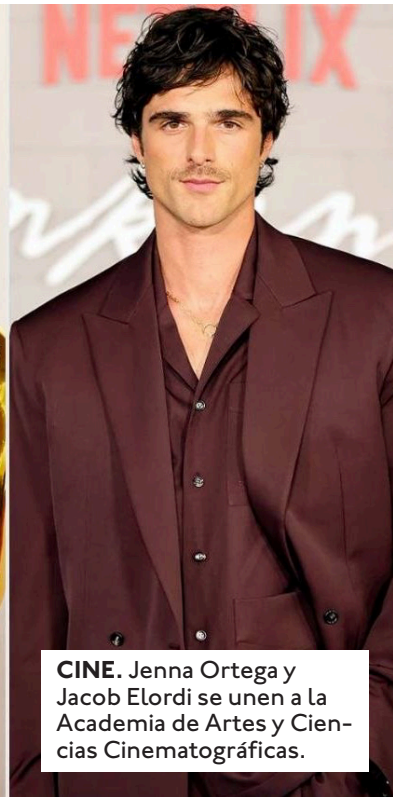
CINE. Jenna Ortega y Jacob Elordi se unen a la Academia de Artes y Ciencias Cinematográficas.

Entre ellos se encuentran Jacob Elordi y Mia Goth, quienes forman parte del elenco de "Frankenstein"; Jenna Ortega, conocida por sus participaciones en "Beetlejuice Beetlejuice" y "Death of a Unicorn"; Julia Garner, protagonista de "Weapons"; y Josh O'Connor, quien encabeza el reparto de "Wake Up Dead Man: A Knives Out Mystery".