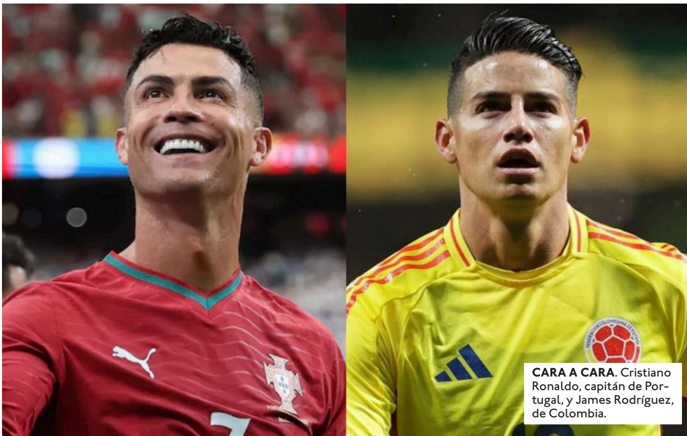
CARA A CARA. Cristiano Ronaldo, capitán de Portugal, y James Rodríguez, de Colombia.