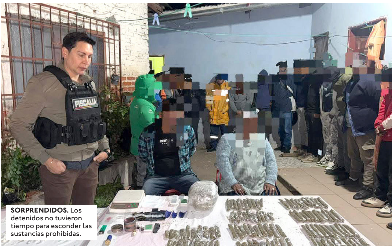
SORPRENDIDOS. Los detenidos no tuvieron tiempo para esconder las sustancias prohibidas.

ESTA ACCIÓN SE REALIZÓ EL JUEVES 25 DE JUNIO POR LA NOCHE, CON EL APOYO DE INTELIGENCIA Y LA COORDINACIÓN DE LA FELCN Y LA FISCALÍA.