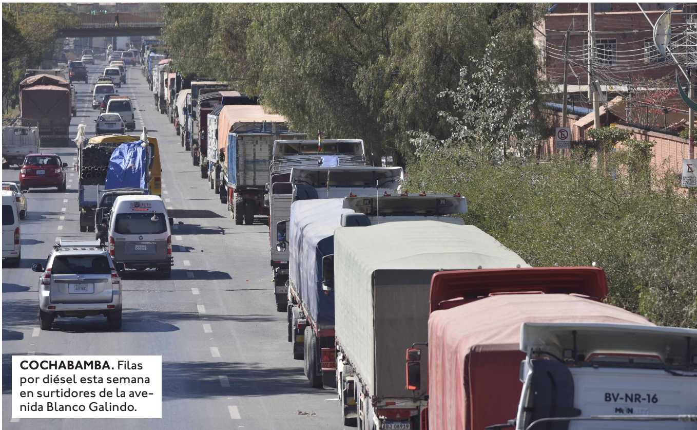
COCHABAMBA. Filas por diésel esta semana en surtidores de la avenida Blanco Galindo.