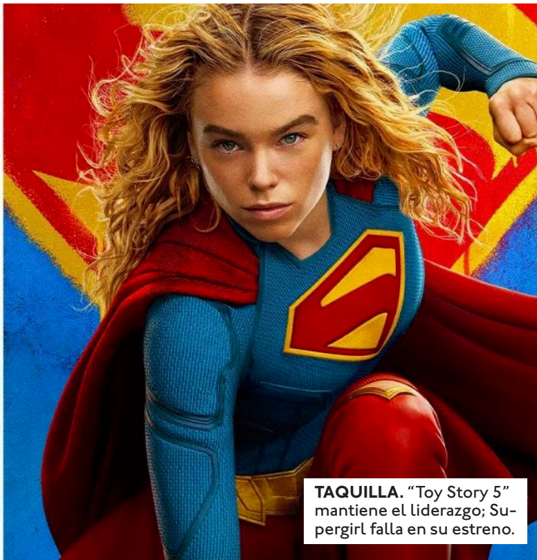
TAQUILLA. "Toy Story 5" mantiene el liderazgo; Supergirl falla en su estreno.