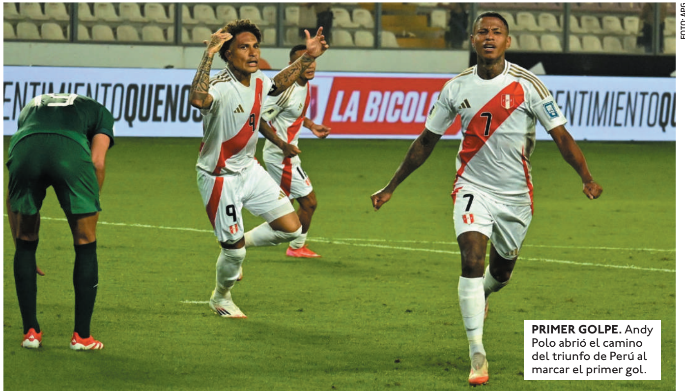
PRIMER GOLPE. Andy Polo abrió el camino del triunfo de Perú al marcar el primer gol.

EL PARTIDO ANTE COLOMBIA SE ENCONTRABA 1-1, PERO A LOS 90'+9, EL JUGADOR DEL REAL MADRID SACÓ UN DISPARO DE LARGA DISTANCIA PARA MARCAR EL 2-1 DEFINITIVO.