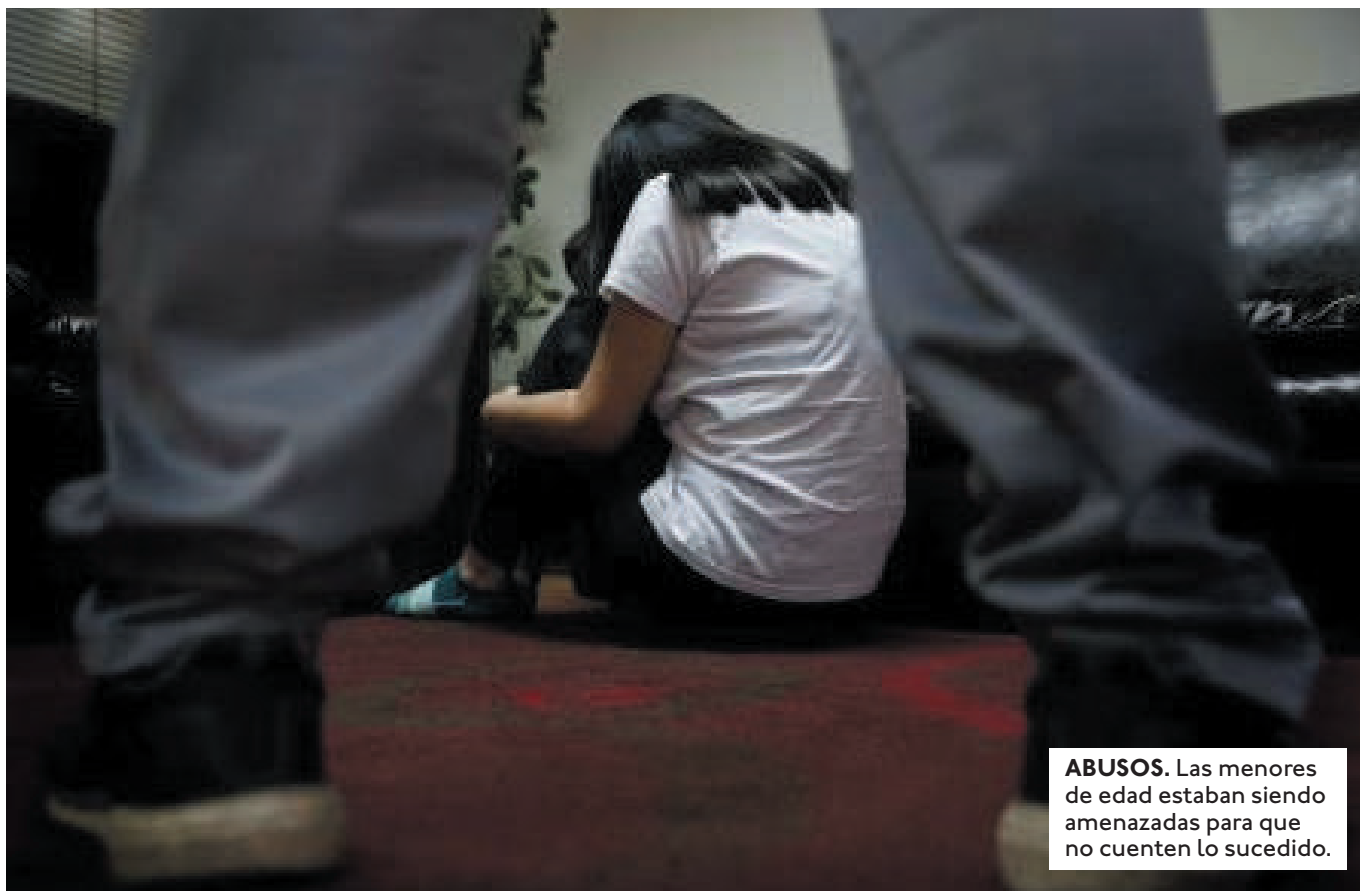
ABUSOS. Las menores de edad estaban siendo amenazadas para que no cuenten lo sucedido.

TRAS PEDIR FOTOS ÍNTIMAS A SUS ESTUDIANTES UN PROFESOR RECIBE DETENCIÓN PREVENTIVA POR LOS DELITOS DE CORRUPCIÓN DE MENORES Y PORNOGRAFÍA.