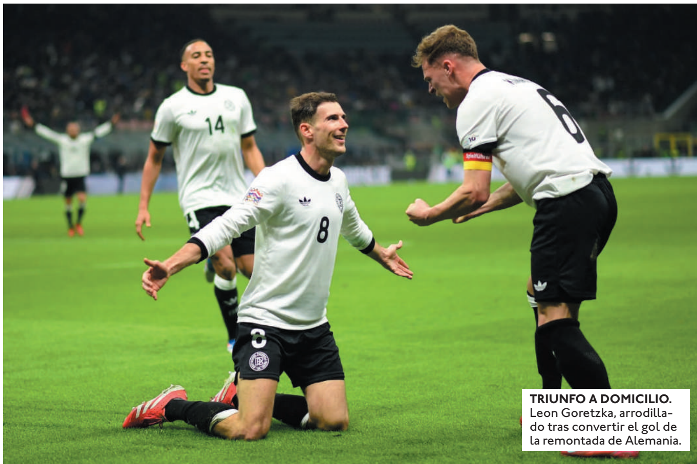
TRIUNFO A DOMICILIO. Leon Goretzka, arrodillado tras convertir el gol de la remontada de Alemania.

EL GANADOR ENTRE ITALIA-ALEMANIA SE ENFRENTARÁ AL GANADOR ENTRE DINAMARCA-PORTUGAL. MIENTRAS QUE EL GANADOR DE PAÍSES BAJOS-ESPAÑA CON CROACIA O FRANCIA.