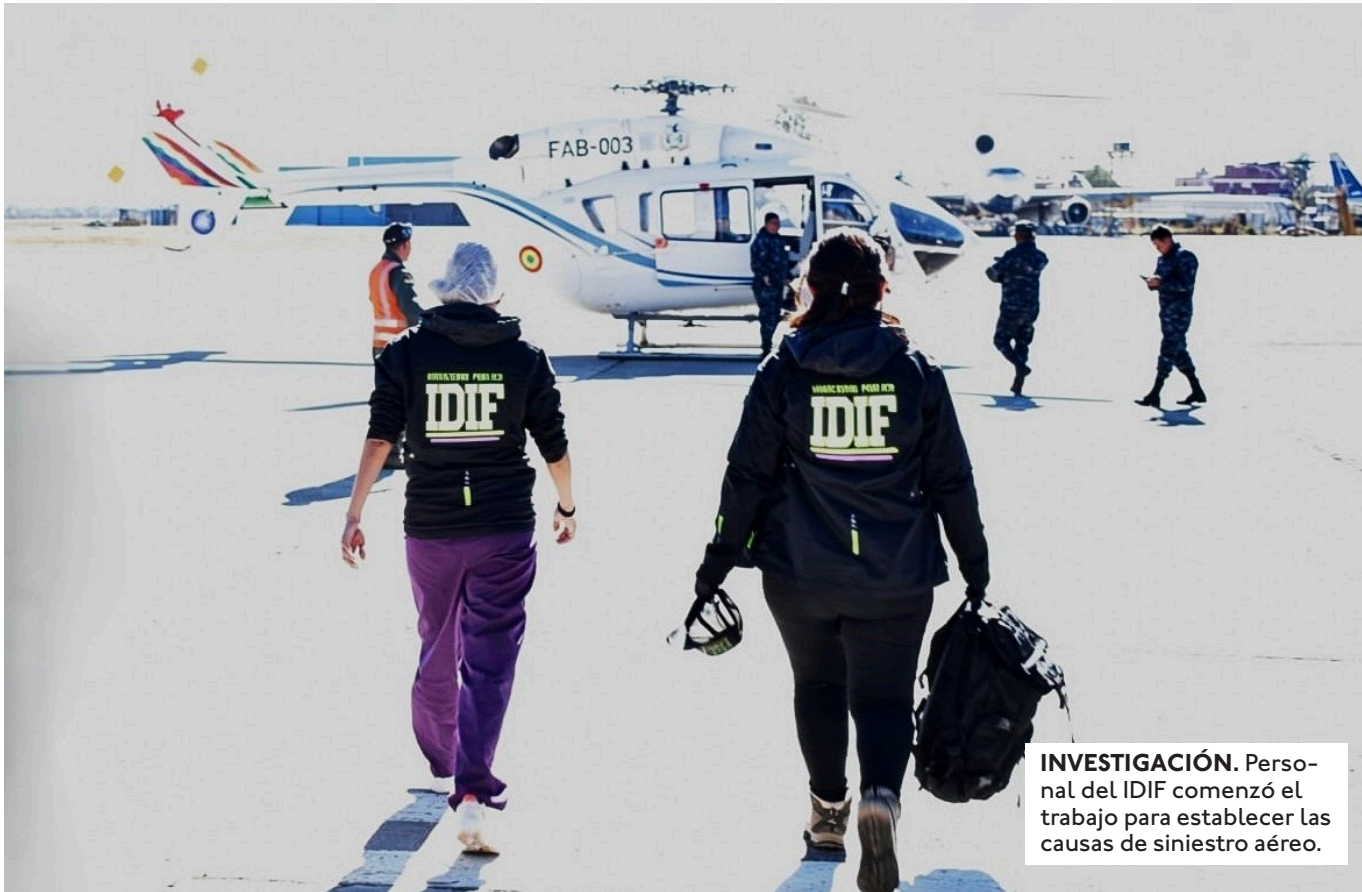
INVESTIGACIÓN. Personal del IDIF comenzó el trabajo para establecer las causas de siniestro aéreo.

EL MINISTERIO DE DEFENSA Y EL COMANDO GENERAL DE LA FUERZA AÉREA BOLIVIANA RINDIERON HOMENAJE A LOS FALLECIDOS Y REAFIRMARON SU COMPROMISO DE BRINDAR APOYO A LAS FAMILIAS AFECTADAS.