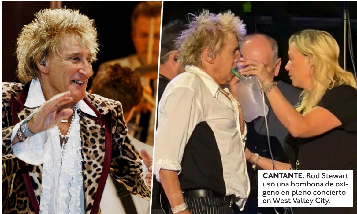
CANTANTE. Rod Stewart usó una bombona de oxígeno en pleno concierto en West Valley City.

El incidente se produce en medio de un período de problemas de salud para Stewart. Una semana antes, el 12 de junio, el cantante canceló un concierto en San Diego menos de una hora antes del inicio. Los organizadores atribuyeron la cancelación inicialmente a una infección sinusal, pero el