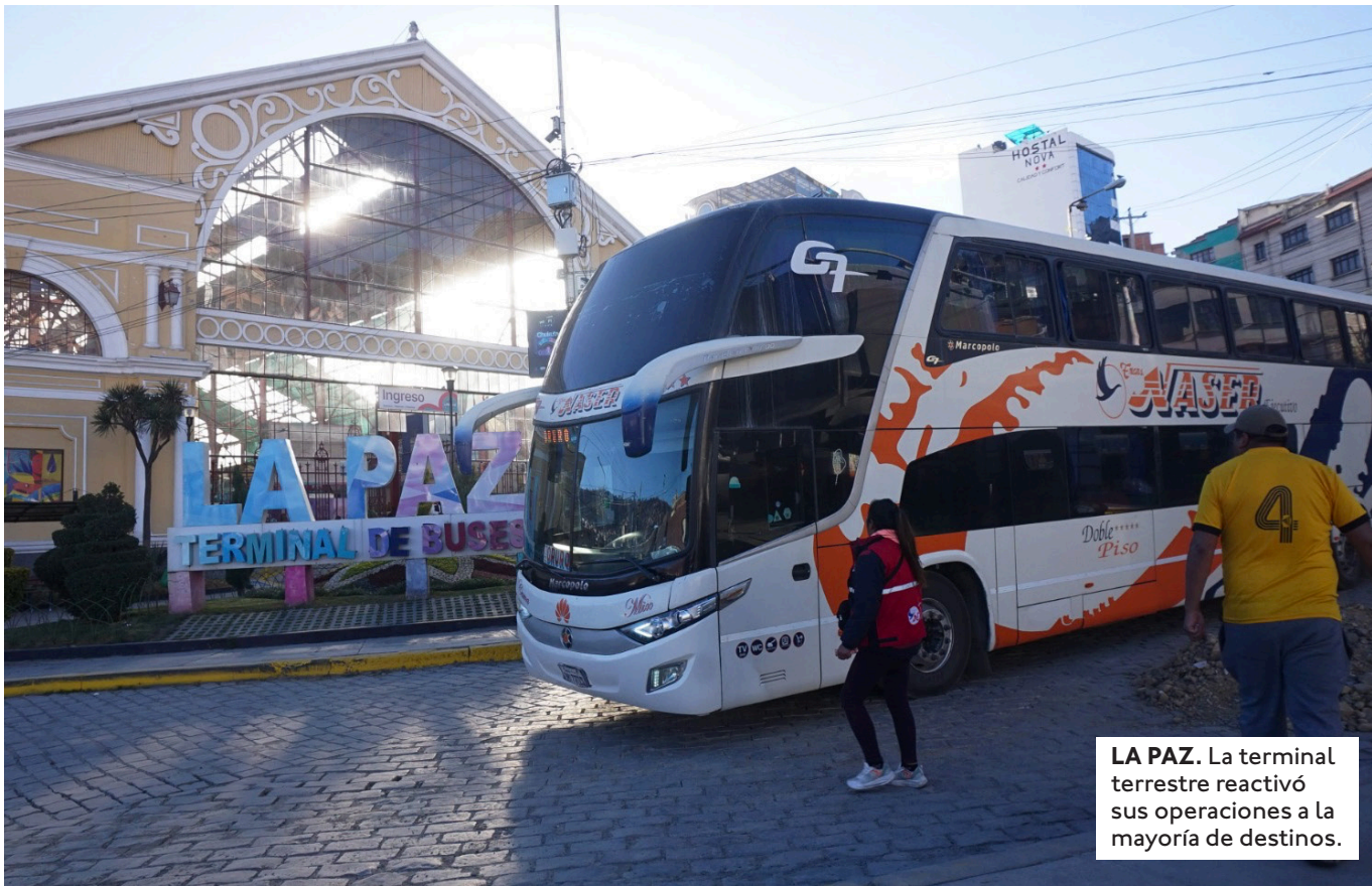
LA PAZ. La terminal terrestre reactivó sus operaciones a la mayoría de destinos.

EN COCHABAMBA, SEGÚN INFORMÓ RED UNO, LA TERMINAL REABRIÓ Y LAS SALIDAS ESTÁN HABILITADAS HACIA SANTA CRUZ, POR LA CARRETERA ANTIGUA, Y HACIA SUCRE, LO QUE PERMITE LLEGAR ADEMÁS A POTOSÍ, TARIJA Y EL CHACO.