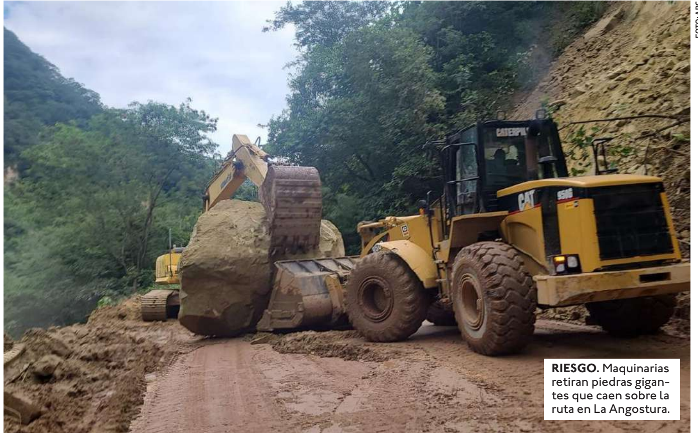
RIESGO. Maquinarias retiran piedras gigantes que caen sobre la ruta en La Angostura.

EN ESTE DEPARTAMENTO SE HAN REPORTADO DERRUMBES Y CRECIDAS DE RÍOS. EN LARECAJA RESCATARON A UN HOMBRE QUE SE AFERRÓ A UN ÁRBOL PARA NO SER ARRASTRADO POR EL RÍO TIPUANI, SEGÚN VIDEO EN REDES SOCIALES.