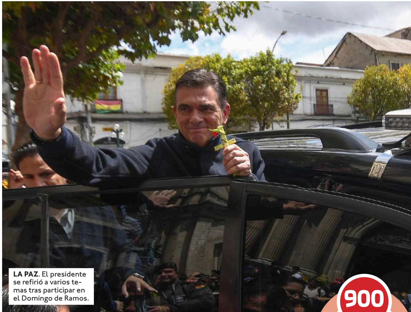
LA PAZ. El presidente se refirió a varios temas tras participar en el Domingo de Ramos.

Paz también se refirió al proyecto de distribución de recursos 50/50 entre Estado y municipios, asegurando que se trata de un concepto de desarrollo y crecimiento nacional: "Quiero que el país crezca y sea más grande; cuanto más grande la economía, mayor capacidad de tener retornos, y esos retornos se reinviertan".