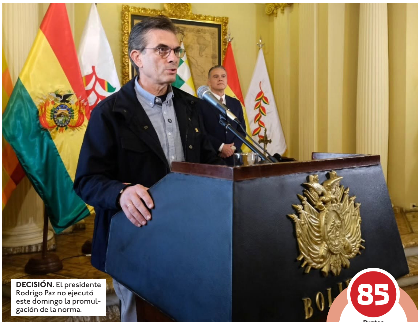
DECISIÓN. El presidente Rodrigo Paz no ejecutó este domingo la promulgación de la norma.

"No sé qué está esperando el presidente para promulgarla. La urgencia del país, especialmente en La Paz y El Alto, así lo exige", manifestó el legislador tras una sesión parlamentaria que se prolongó por cerca de 16 horas. La norma fue debatida en medio