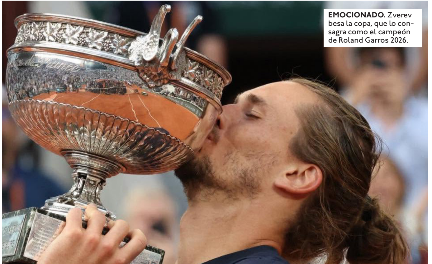
EMOCIONADO. Zverev besa la copa, que lo consagra como el campeón de Roland Garros 2026.

EL ÚLTIMO TÍTULO MASCULINO DE GRAND SLAM, PARA UN TENISTA ALEMÁN, FUE HACÉ 30 AÑOS. BORIS BECKER CONQUISTÓ EL ABIERTO DE AUSTRALIA.