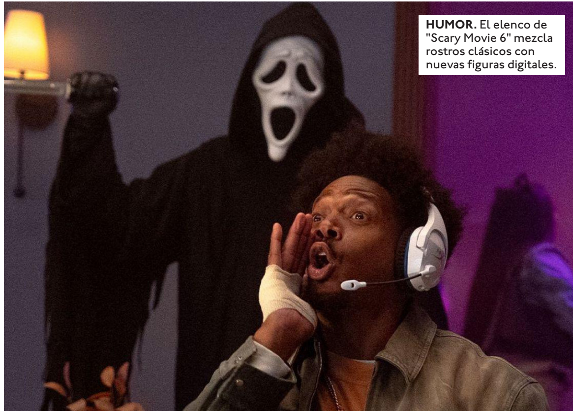
HUMOR. El elenco de "Scary Movie 6" mezcla rostros clásicos con nuevas figuras digitales.

La reinención de la sátira y el humor contemporáneo. El rotundo éxito comercial de "Scary Movie 6" radica en su audaz y actualizada propuesta argumental, la cual enfoca sus baterías humorísticas en parodiar de forma milimétrica los mayores éxitos del cine de terror moderno y las producciones de suspenso psicológico que han dominado las salas en los últimos años. Elementos característicos del llamado "terror