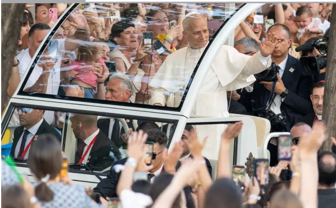
MADRID. Más de 1,2 millones de fieles participaron este domingo en la misa presidida por el papa León XIV en la plaza de Cibeles de Madrid, el acto más multitudinario de su visita a España. El pontífice recorrió previamente varias calles de la capital en papamóvil y fue recibido por autoridades españolas antes de encabezar la celebración del Corpus Christi.