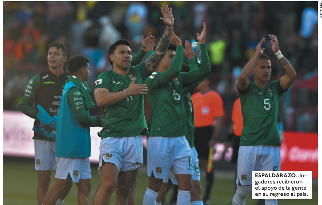
ESPALDARAZO. Jugadores recibieron el apoyo de la gente en su regreso al país.

LOS JUGADORES DE LA VERDE REGRESARON ESTE MIÉRCOLES AL PAÍS Y FUERON RECIBIDOS POR UNA BANDA DE MÚSICA EN VIRU VIRU. LES OBSEQUIARON SOMBREROS DE SAO, PRENDA TÍPICA DE SANTA CRUZ.