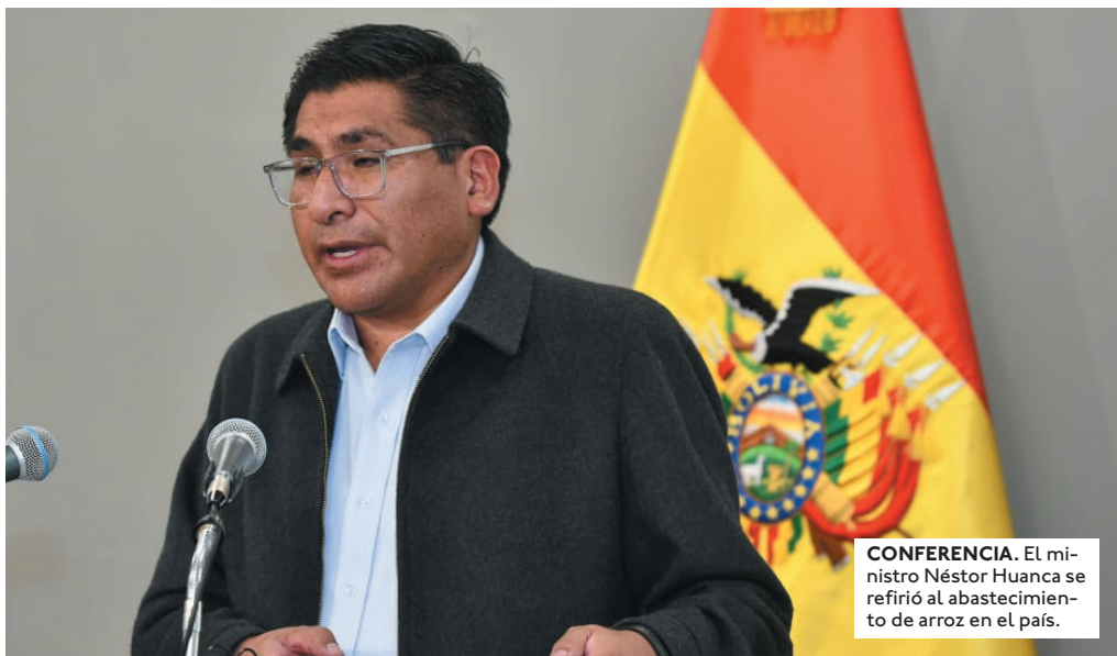
CONFERENCIA. El ministro Néstor Huanca se refirió al abastecimiento de arroz en el país.

ANTES, EL GOBIERNO DECRETÓ ARANCEL CERO EN PRODUCTOS DE ASEO PERSONAL, MEDICAMENTOS E INSUMOS Y REPUESTOS PARA VEHÍCULOS