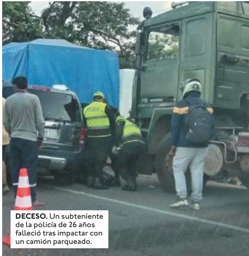
DECESO. Un subteniente de la policía de 26 años falleció tras impactar con un camión parqueado.

UN MICRO DE LA LÍNEA 82 IMPACTÓ CONTRA UNA BARDA EN LA ZONA DEL PARQUE INDUSTRIAL, ENTRE EL CUARTO Y QUINTO ANILLO.