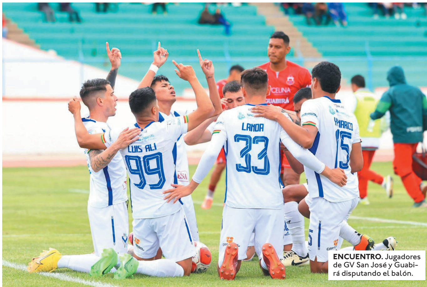
ENCUENTRO. Jugadores de GV San José y Guabirá disputando el balón.

EL EQUIPO MONTEREÑO PUEDE QUEDARSE FUERA DE LOS PUESTOS DE CLASIFICACIÓN PARA COMPETICIONES INTERNACIONALES.