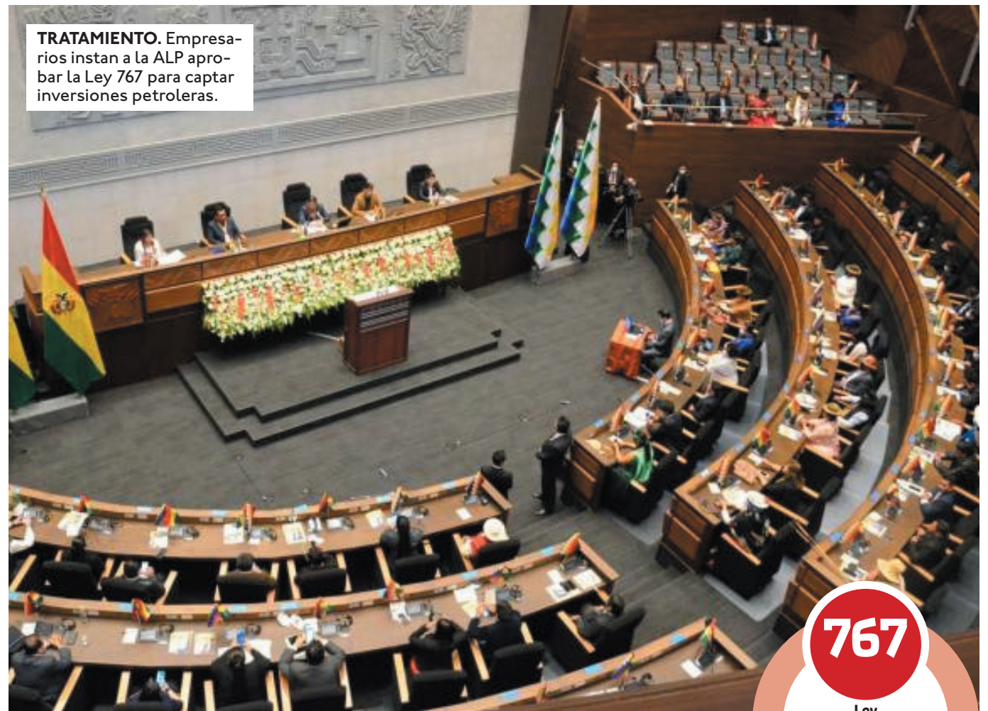
TRATAMIENTO. Empresarios instan a la ALP aprobar la Ley 767 para captar inversiones petroleras.

En este contexto, la Confederación destacó la promulgación del Decreto Supremo 5271, que amplía el alcance del Decreto 5218, firmado entre el gobierno y los sectores productivos, como una alternativa adecuada para garanti-