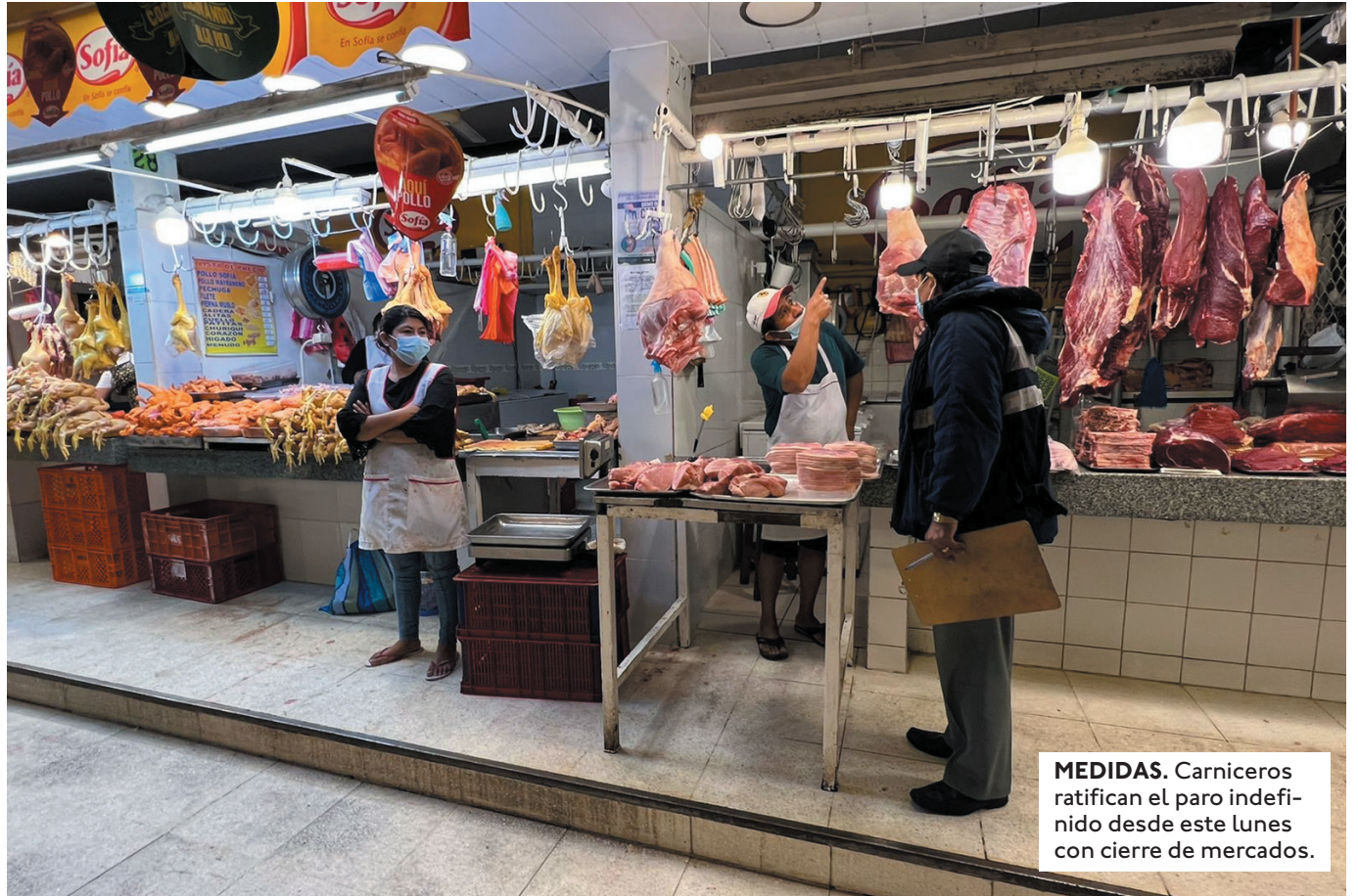
MEDIDAS. Carniceros ratifican el paro indefinido desde este lunes con cierre de mercados.

LOS COMERCIALIZADORES DE CARNE DEL MERCADO ANTIGUO LOS POZOS NO ACATARÁN EL PARO INDEFINIDO CONVOCADO PARA ESTE LUNES