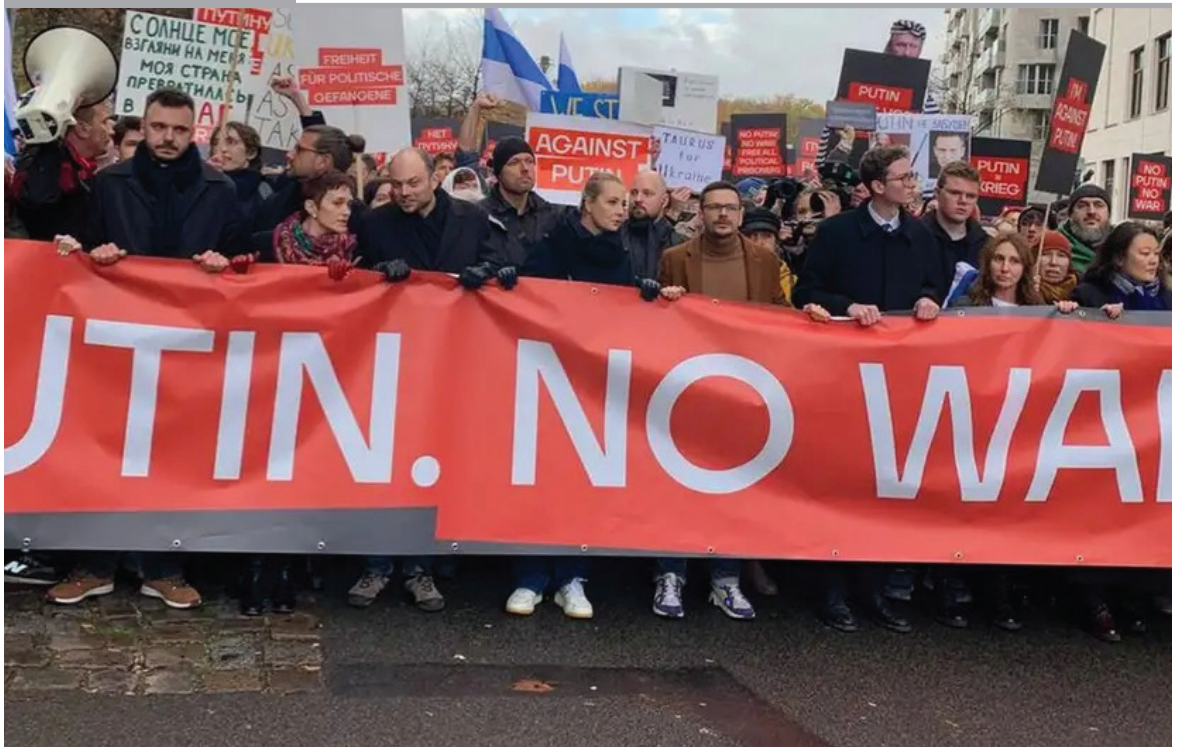
LA OPOSICIÓN RUSA EN EL EXILIO MARCHA EN BERLÍN CONTRA PUTIN. Es la primera gran manifestación organizada en Alemania por opositores rusos como Yulia Navalnaya o Vladimir Kara-Murza, cuyo poder de convocatoria será puesto a prueba. Asociaciones ucranianas han criticado la marcha.