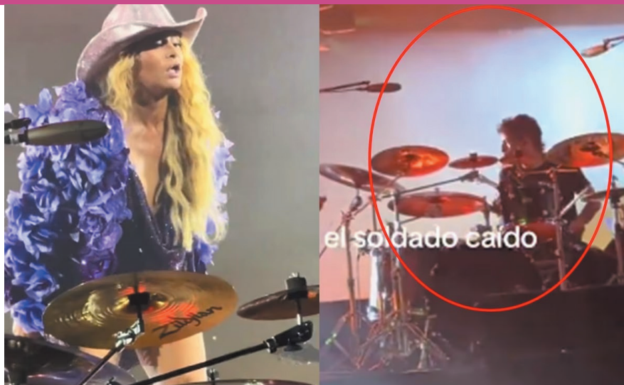
el soldado caído

"A ver batería... ¿qué pedo, cabr*n?, ¿qué pedo?"