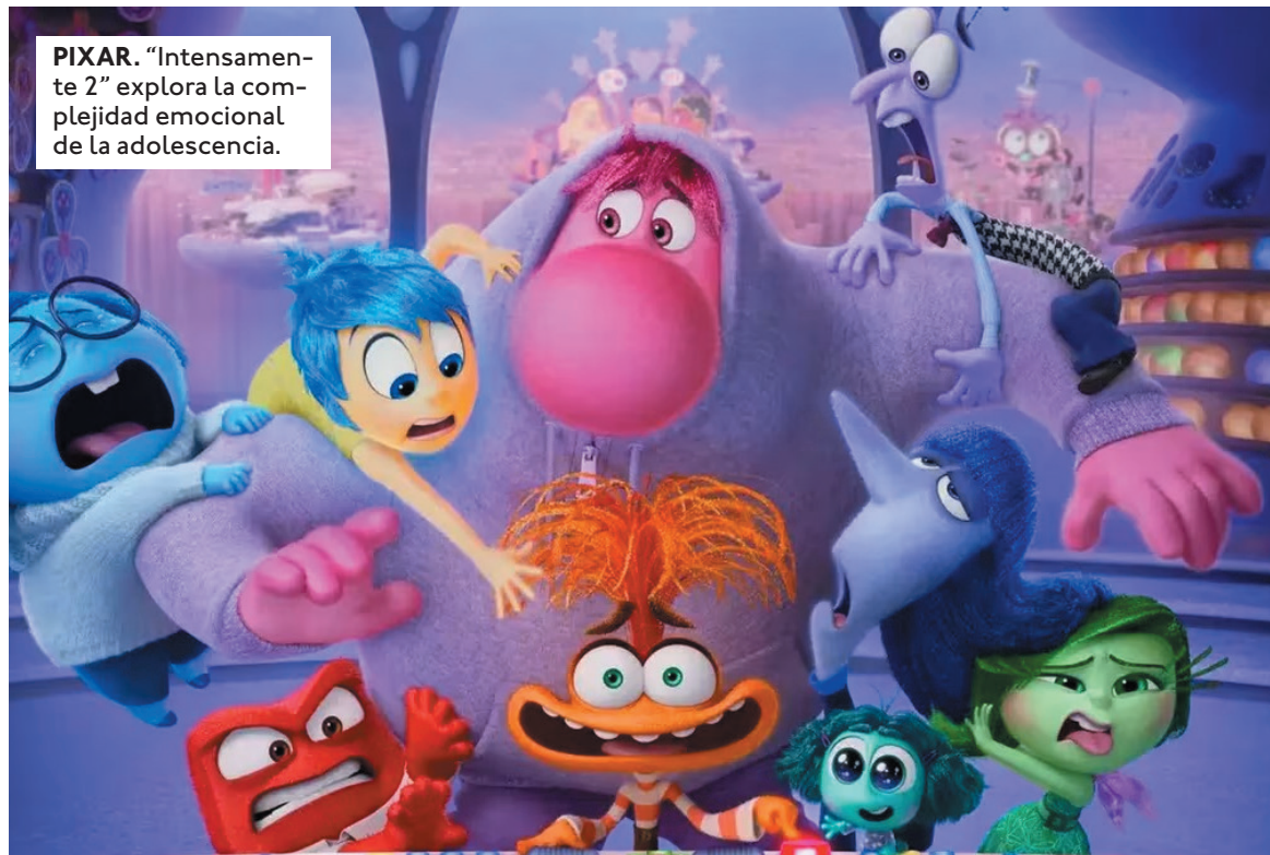
PIXAR. "Intensamente 2" explora la complejidad emocional de la adolescencia.

En el mercado doméstico, Intensamente 2 ya es la novena película animada más taquillera de todos