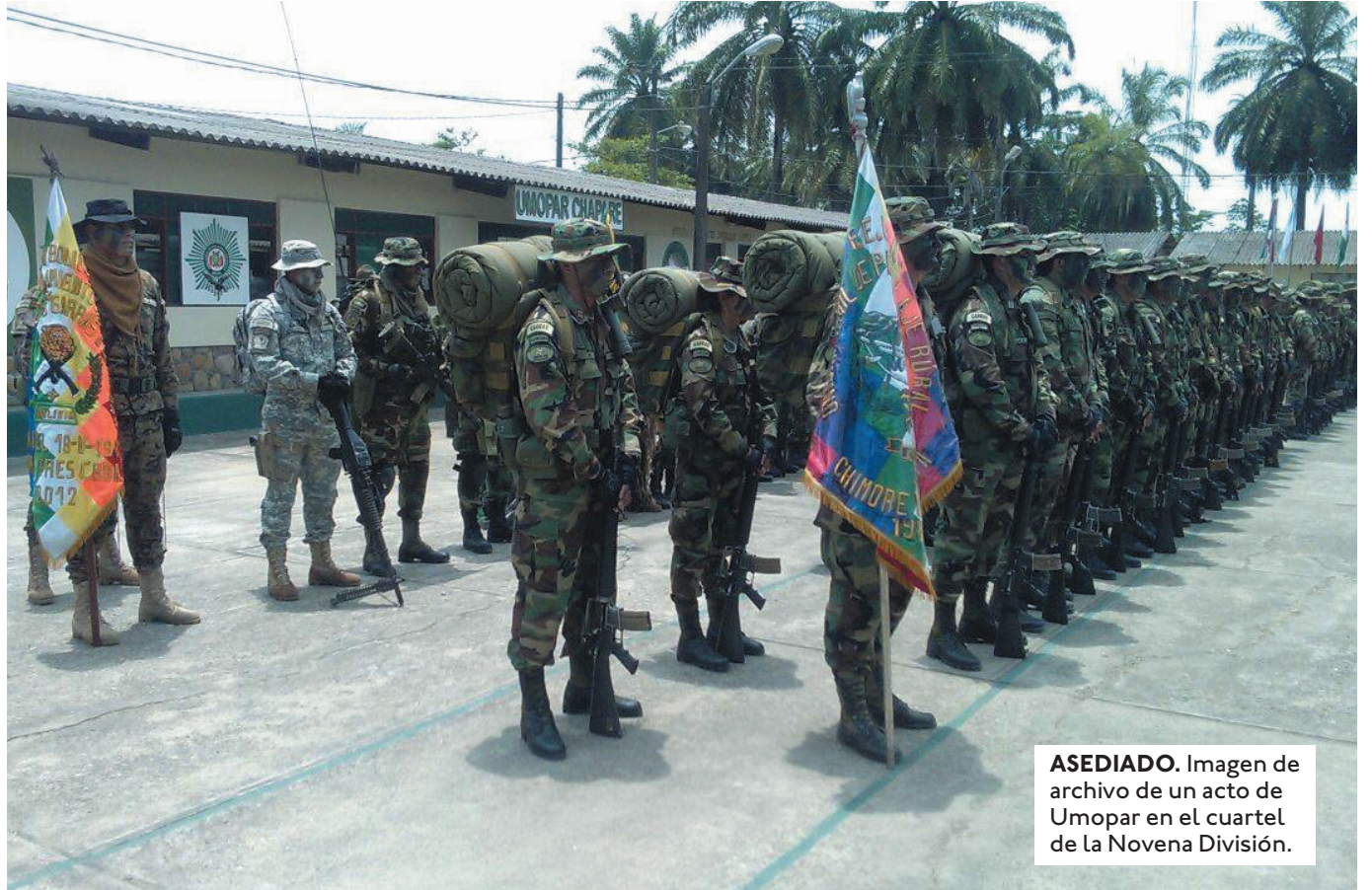
ASEDIADO. Imagen de archivo de un acto de Umopar en el cuartel de la Novena División.

EL COMITÉ CÍVICO DE COCHABAMBA DENUNCIÓ EN LA FISCALÍA A MORALES Y OTROS DIRIGENTES POR IMPULSAR LOS BLOQUEOS DE CAMINOS EN LA REGIÓN.