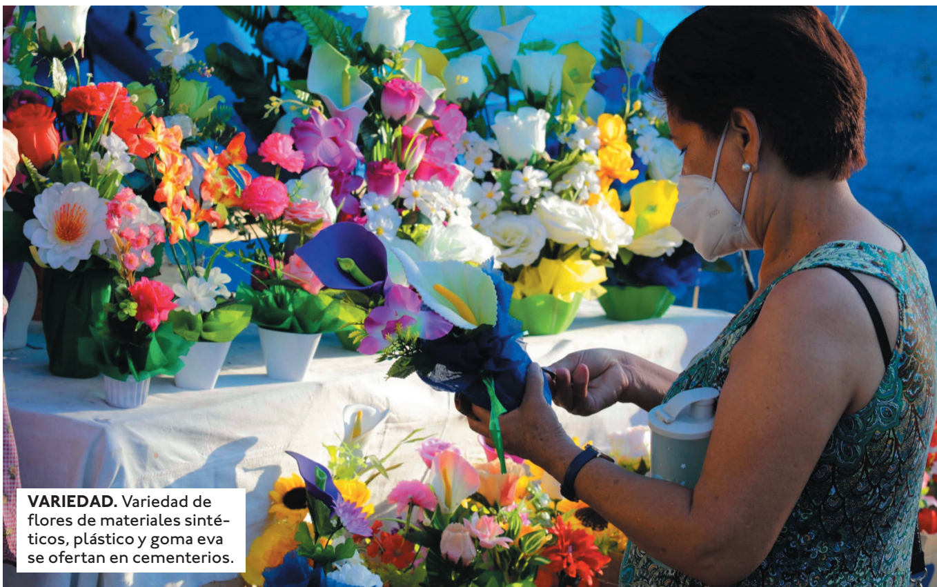
VARIEDAD. Variedad de flores de materiales sintéticos, plástico y goma eva se ofertan en cementerios.

LOS CEMENTERIOS ABRESN SUS PUERTAS A LAS VISITAS ESTE 1 Y 2 DE NOVIEMBRE, LA GENTE OPTA POR RAMOS Y CORONAS DE MATERIAL SINTÉTICO.