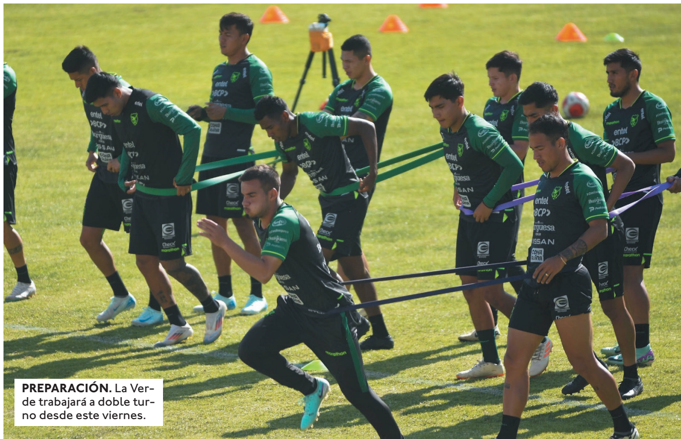
PREPARACIÓN. La Verde trabajará a doble turno desde este viernes.

ENTRE EL 23 DE ENERO Y EL 16 DE FEBRERO SE LLEVARÁ ADELANTE EL SUDAMERICANO SUB-20 MASCULINO EN PERÚ, DONDE BOLIVIA FORMA PARTE DEL GRUPO B CON BRASIL, COLOMBIA Y CHILE.