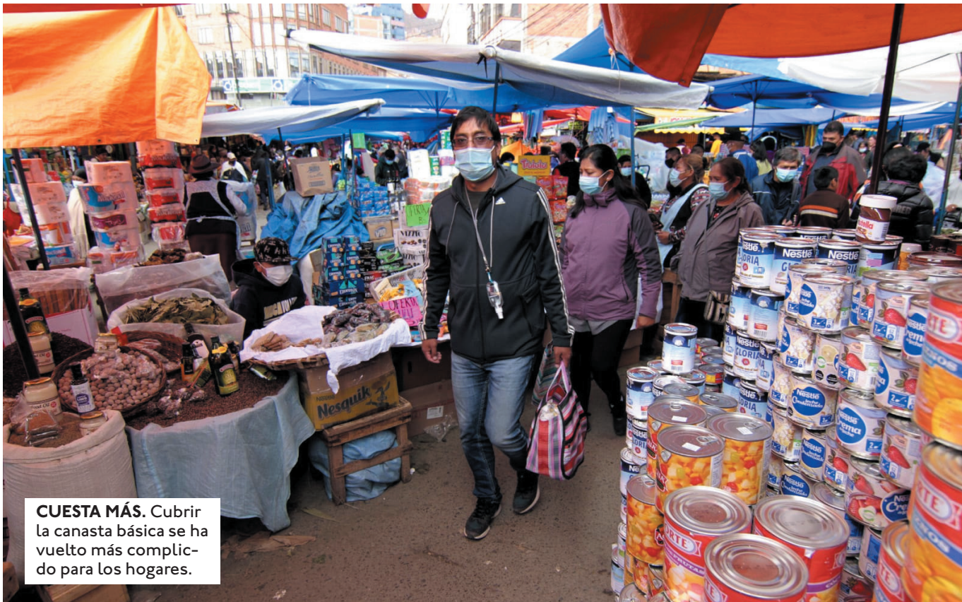
CUESTA MÁS. Cubrir la canasta básica se ha vuelto más complicado para los hogares.

UN 35% VE ALTO RIESGO DE QUE SE DISPARE DESCONTROLADAMENTE Y UN 51% VE ALGO DE RIESGO DE QUE ESTA SITUACION OCURRA.