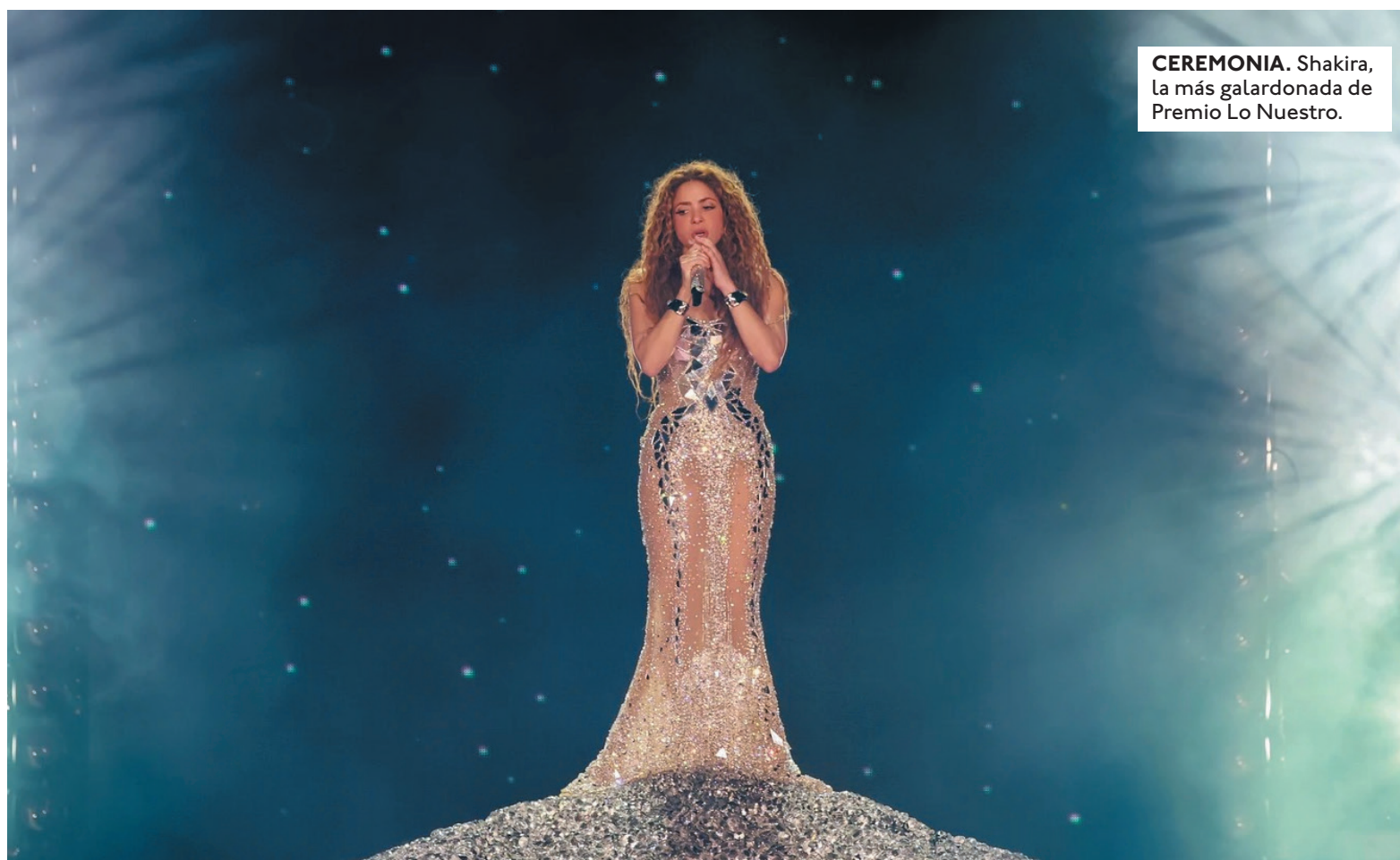
CEREMONIA. Shakira, la más galardonada de Premio Lo Nuestro.

GALA. La cantante colombiana arrasó al ganar seis premios de los nueve a los que estaba nominada, seguida por Carín León, quien ganó cinco galardones.