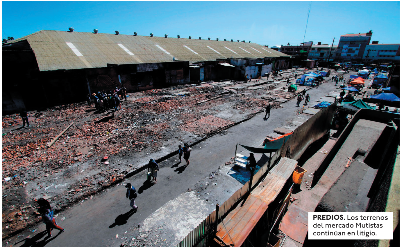
PREDIOS. Los terrenos del mercado Mutistas continúan en litigio.