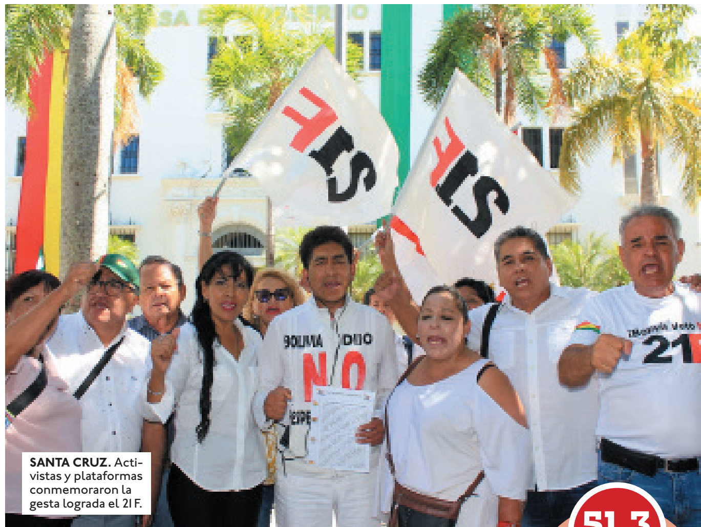
SANTA CRUZ. Activistas y plataformas conmemoraron la gesta lograda el 21F.

Otras voces. Jorge Tuto Quiroga, también en redes sociales, mandó un mensaje a Morales: "Evo: NO es NO, mana, janiwa, nunca más. Eres el pasado, adelante viene el cambio radical, y tú rendirás cuentas por tus crímenes". Luis Fernando Camacho señaló que el 21F fue "el inicio de la recuperación de la democracia en Bolivia" y un "triumfo de la gente", que Evo Morales burló al repositarse posteriormente.