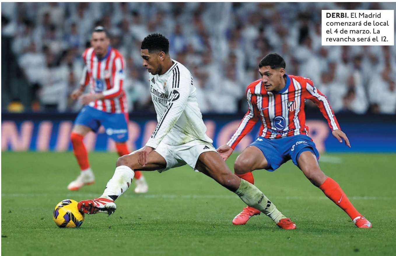
DERBI. El Madrid comenzará de local el 4 de marzo. La revancha será el 12.

"PARTIDAZO Y ESTAMOS PREPARADOS. ESO ES LO QUE ME SALE. PARTIDAZO Y ESTAMOS PREPARADOS", DECLARÓ EL DIRECTOR TÉCNICO DE ATLÉTICO MADRID.