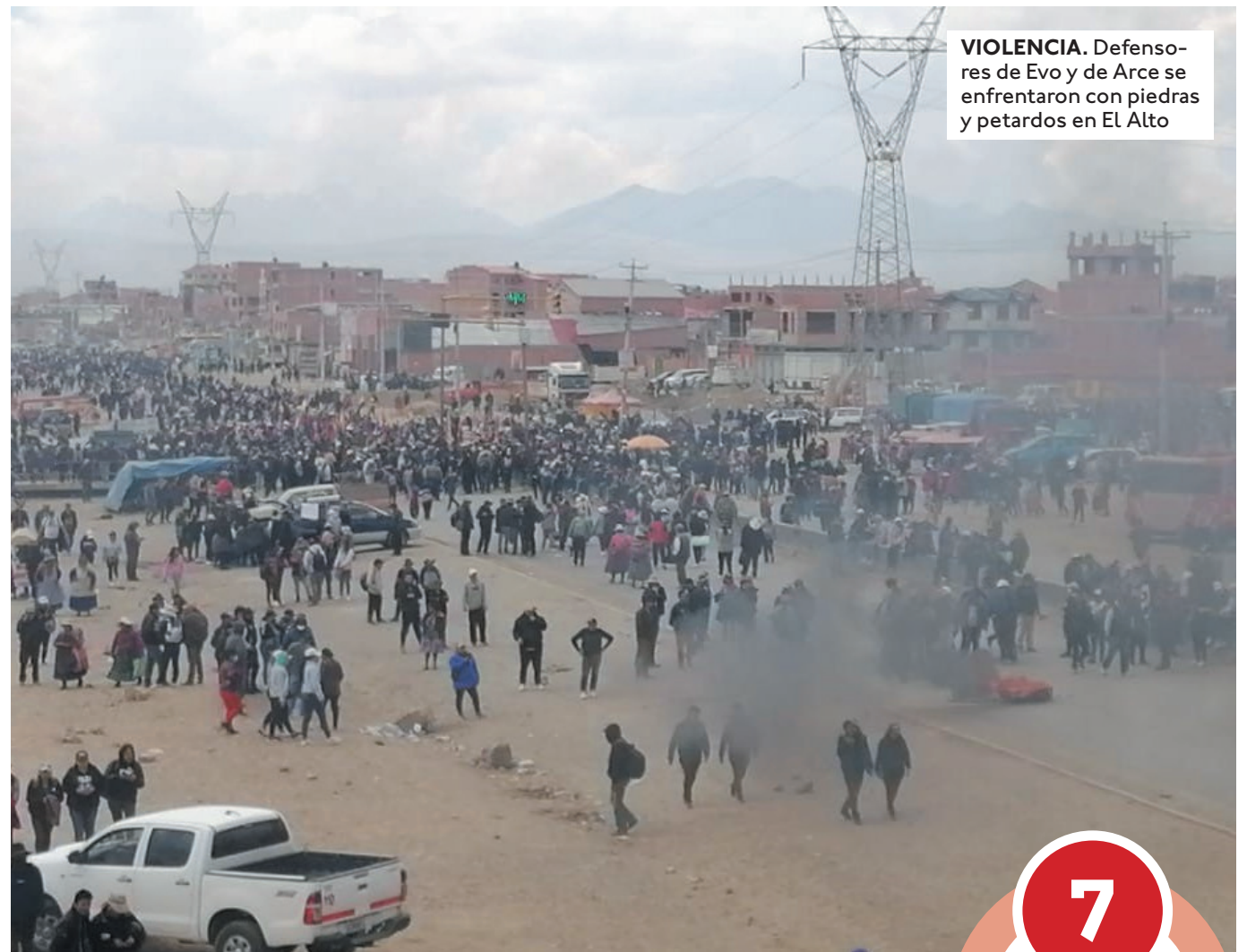
VIOLENCIA. Defensores de Evo y de Arce se enfrentaron con piedras y petardos en El Alto

En defensa de Arce. Desde muy temprano, miles de personas se movilizan en la ciudad de El Alto rumbo a Ventilla, para expresar su apoyo al gobierno del presidente Arce. Afiliados a las organizaciones sociales que son parte del Movimiento Al Socialismo, vecinos de El Alto, funcionarios del Ejecutivo y del gobierno municipal aléno se dirigían hacia ese punto con la defensa de la democracia,