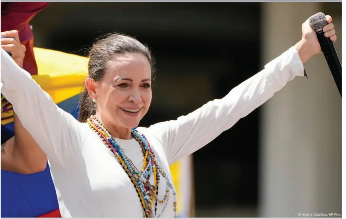
MARÍA CORINA MACHADO: "ESTAMOS CERCA DE LIBERAR A VENEZUELA". En un mensaje en la red social X, la líder opositora pidió al pueblo de Venezuela "serenidad, coraje y firmeza", porque en el chavismo "cada día están más débiles y cada día estamos más fuertes nosotros".