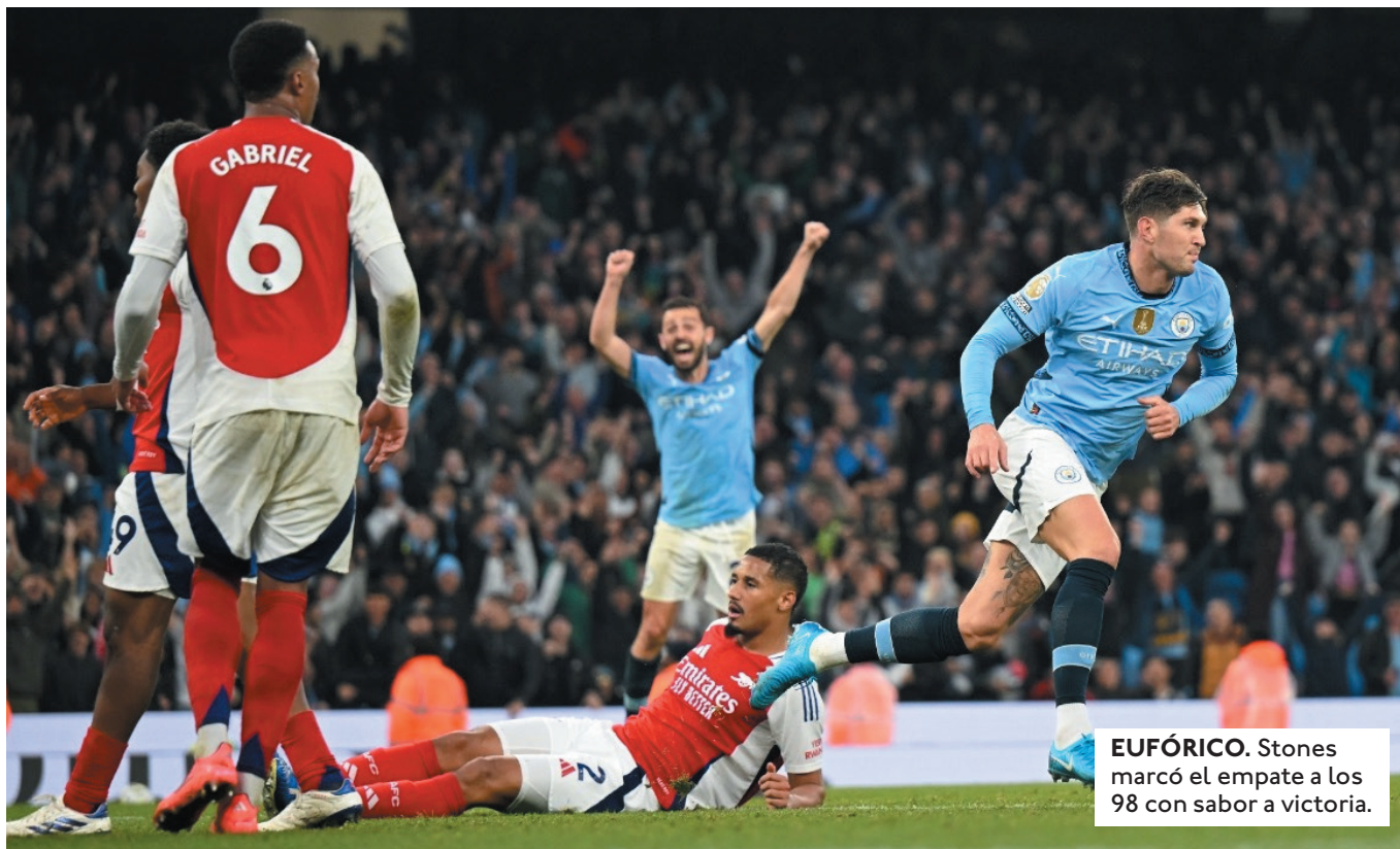
EUFÓRICO. Stones marcó el empate a los 98 con sabor a victoria.

FUE SU 10º GOL EN LAS CINCO PRIMERAS JORNADAS DE LA PREMIER Y EL 100º EN 105 PARTIDOS DESDE SU LLEGADA AL CITY EN 2022.