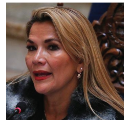
Jeanine Áñez EX PRESIDENTA

La expresidenta Jeanine Áñez dirigiéndose a Luis Arce, Áñez criticó la falta de diálogo de Evo Morales y cómo sus acciones han llevado a su encarcelamiento, mientras él permanece libre. En un extenso post, acusó a Morales de manipular al pueblo boliviano y mentir sobre la nacionalización, la Constitución y la democracia, como si fueran su propiedad.