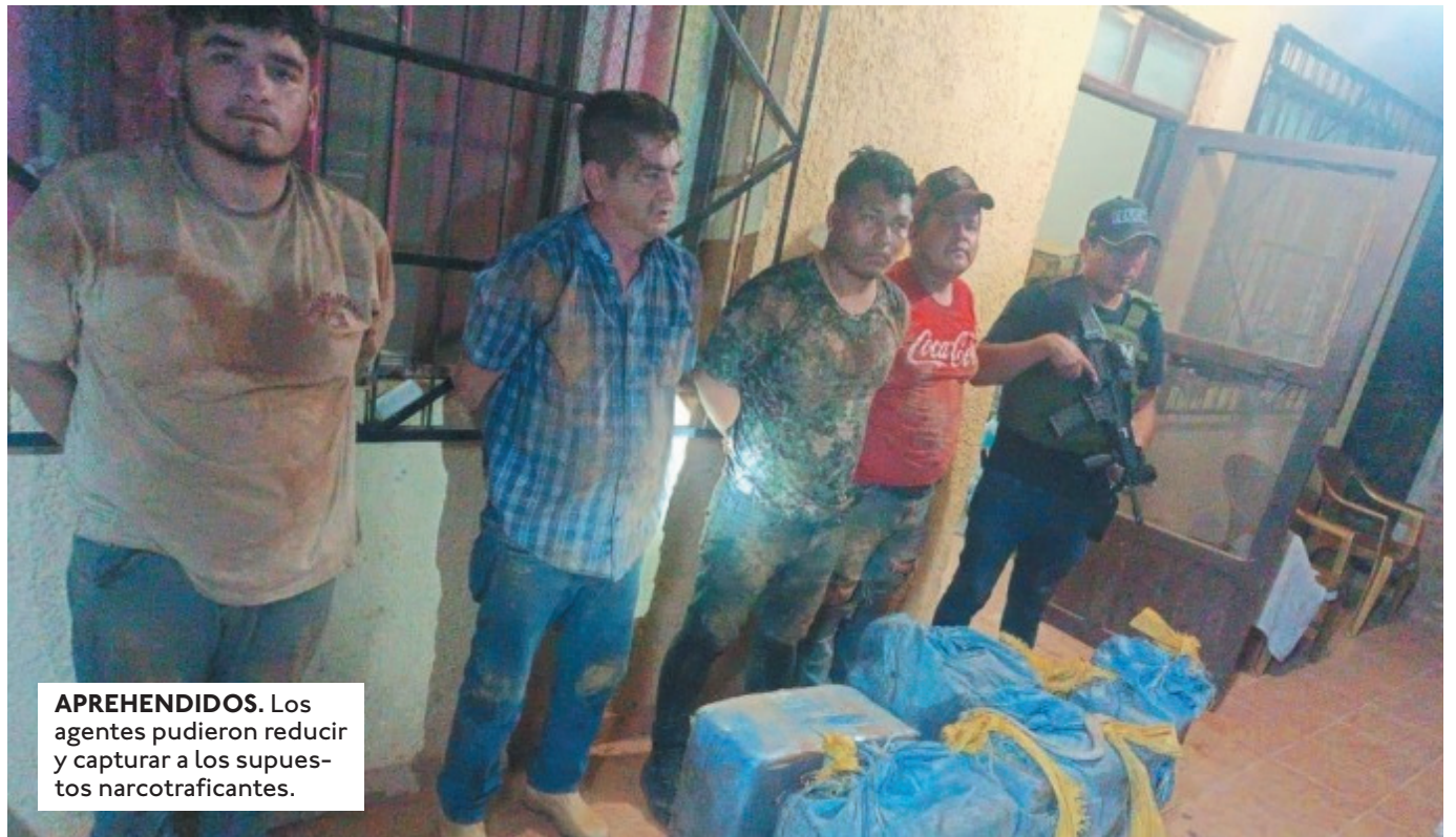
APREHENDIDOS. Los agentes pudieron reducir y capturar a los supuestos narcotraficantes.

EVER CH.R. HOMBRE QUE ESTABA SIENDO BUS-CADO POR EL DELITO DE TENTATIVA DE FEMINICIDIO CONTRA SU EXPAREJA EN LA PAZ.