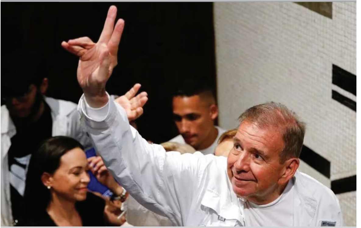
EDMUNDO GONZÁLEZ URRUTIA VOTÓ EN CARACAS: "Estamos preparados para defender hasta el último sufragio". Como nunca antes en los 25 años de régimen chavista, los sondeos de más tradición en el país auguran unánimemente una amplia victoria de Edmundo González Urrutia sobre Nicolás Maduro.