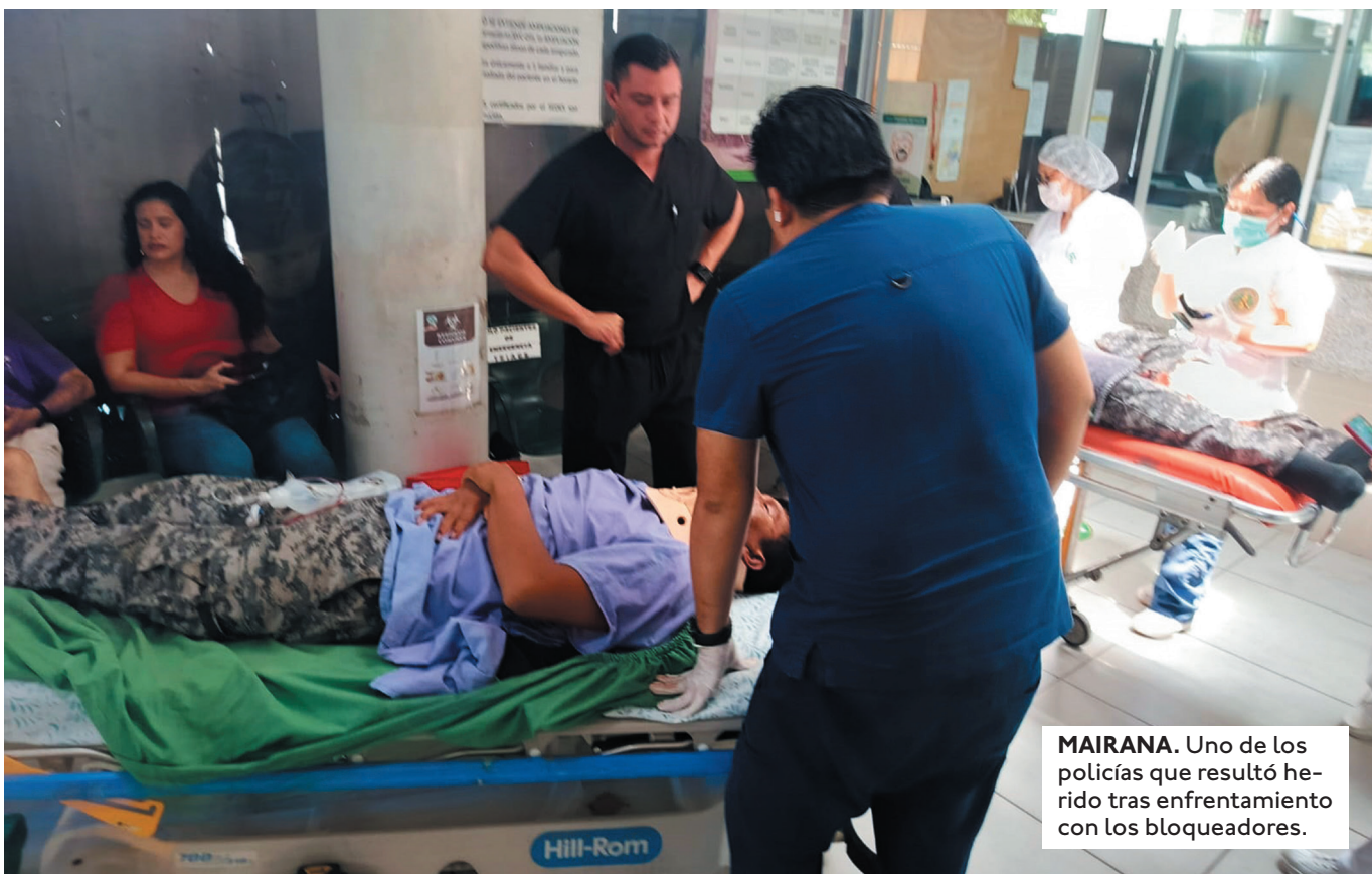
MAIRANA. Uno de los policías que resultó herido tras enfrentamiento con los bloqueadores.

LA COMISIÓN INTERAMERICANA DE DERECHOS HUMANOS PIDIÓ INVESTIGAR CON LA DEBIDA DILIGENCIA EL PRESUNTO ATENTADO CONTRA EVO DEL 27 DE OCTUBRE.