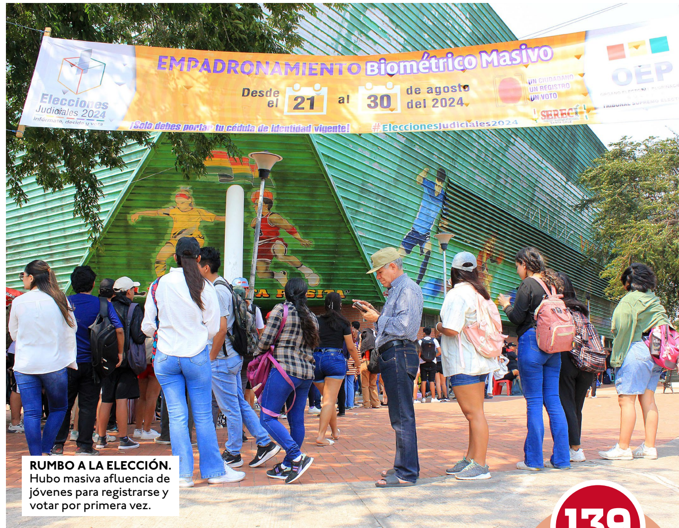
RUMBO A LA ELECCIÓN. Hubo masiva afluencia de jóvenes para registrarse y votar por primera vez.

Montenegro explicó que se trata de un incremento presupuestario, pero si intrapartida, o sea que no exige recursos adicionales al Tesoro General de la Nación (TGN) sino, en todo caso, una recompo-