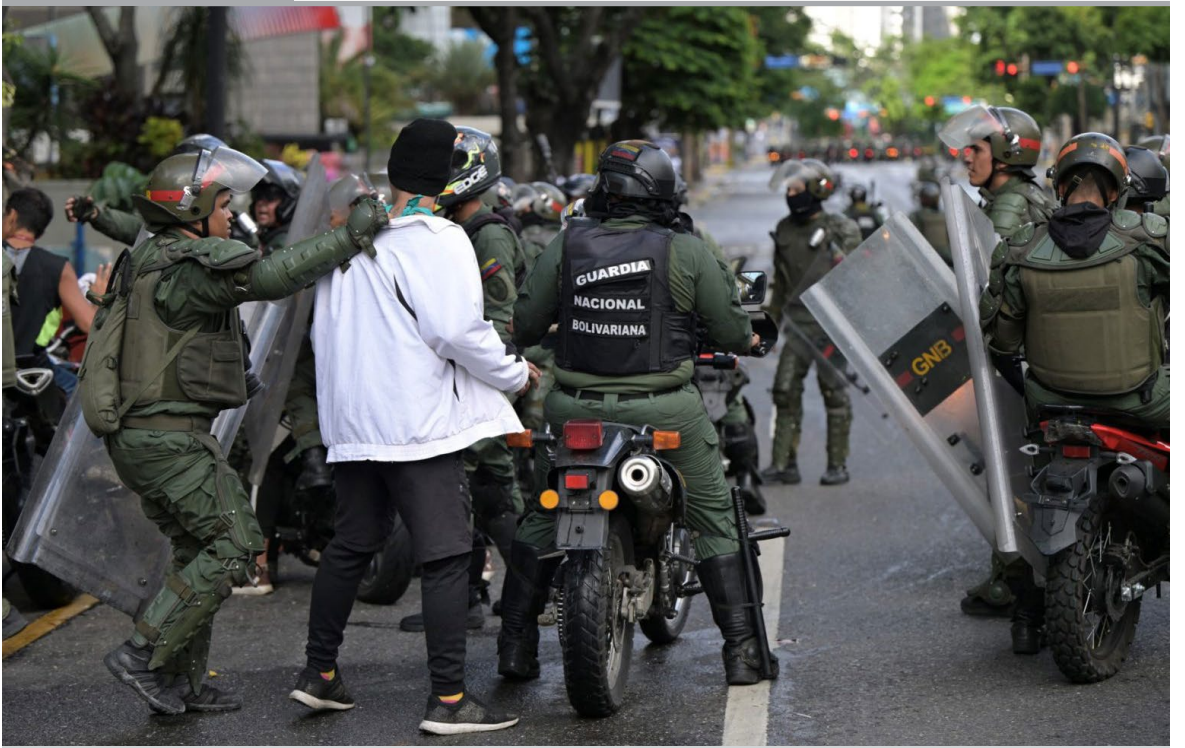
LA REPRESIÓN DE LA DISIDENCIA EN VENEZUELA ALCANZA NUEVAS CIFRAS MORTALES, SEGÚN HUMAN RIGHTS WATCH. El reciente análisis de la organización revela al menos 11 asesinatos durante las protestas tras las controversiales elecciones presidenciales del 28 de julio.