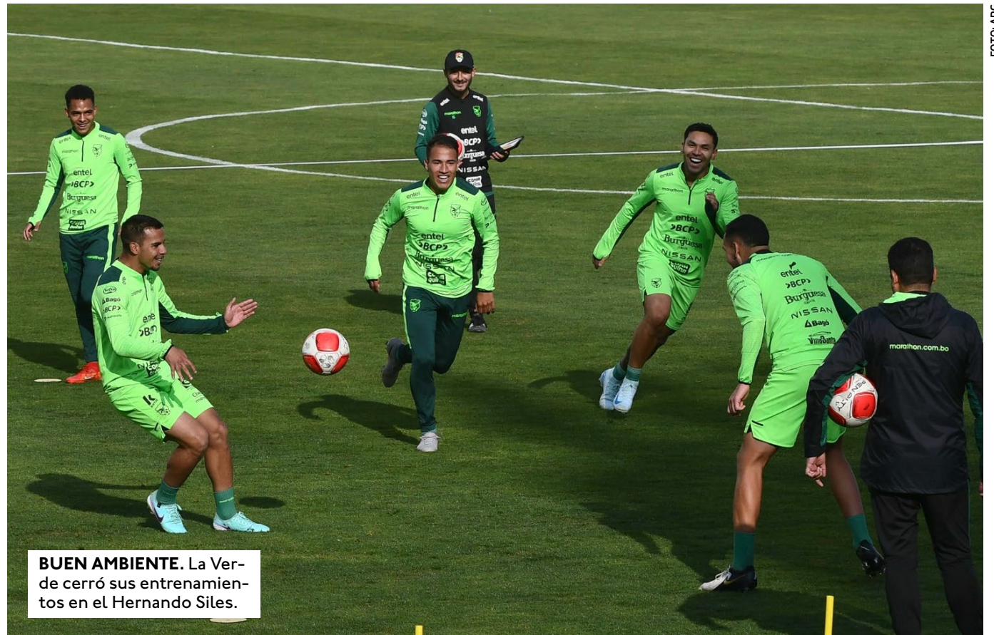
BUEN AMBIENTE. La Verde cerró sus entrenamientos en el Hernando Siles.

A SOLICITUD DE LA FBF, EL MINISTERIO DE TRABAJO DISPUSO "TOLERANCIA EN LA JORNADA LABORAL PARA EL DÍA JUEVES 5 DE SEPTIEMBRE" DESDE LAS 14.30 PARA SERVIDORES PÚBLICOS QUE ASISTAN AL ESTADIO.