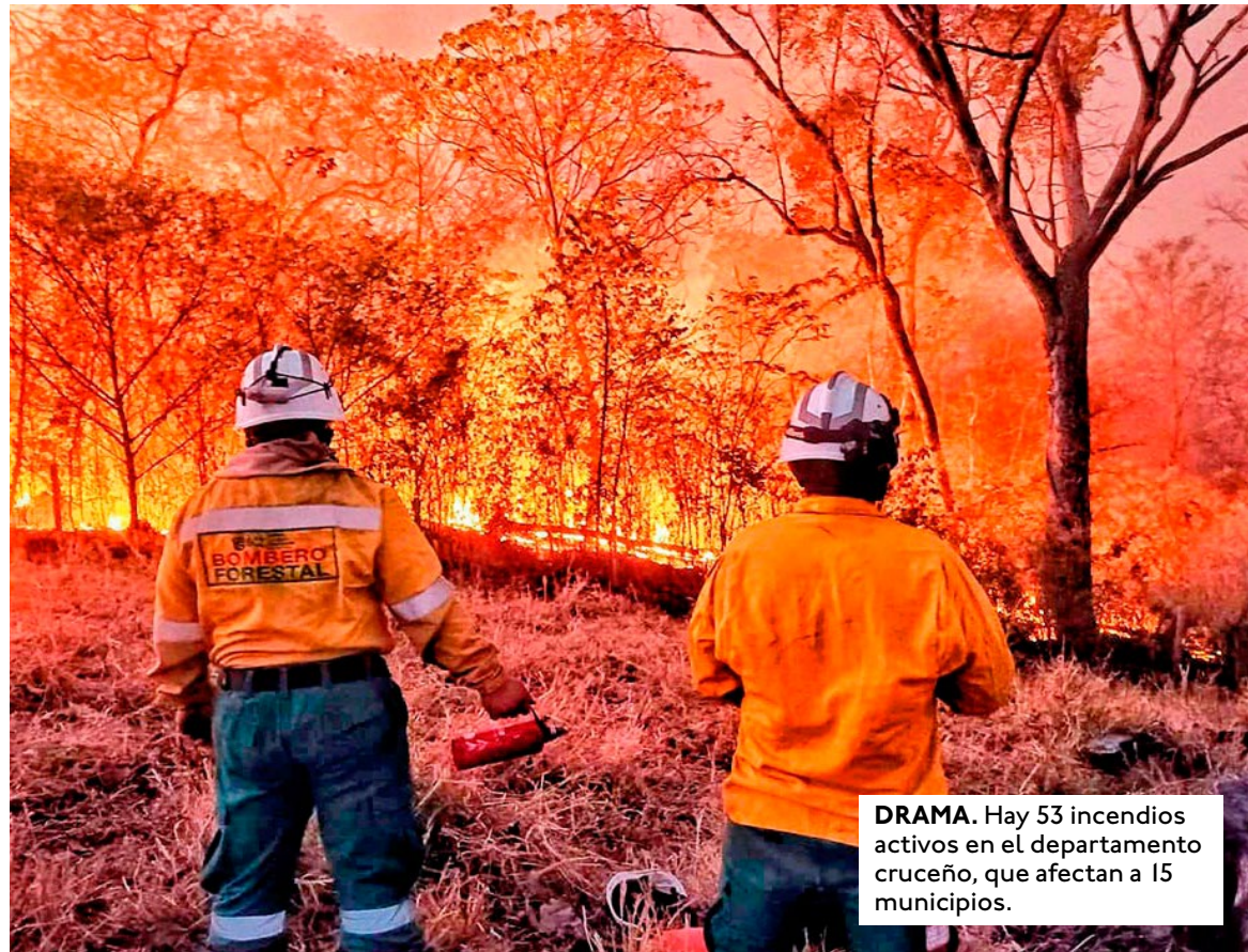
DRAMA. Hay 53 incendios activos en el departamento cruceño, que afectan a 15 municipios.

PANORAMA. 5 aeropuertos y 11 aeródromos tienen restricciones por la poca visibilidad.