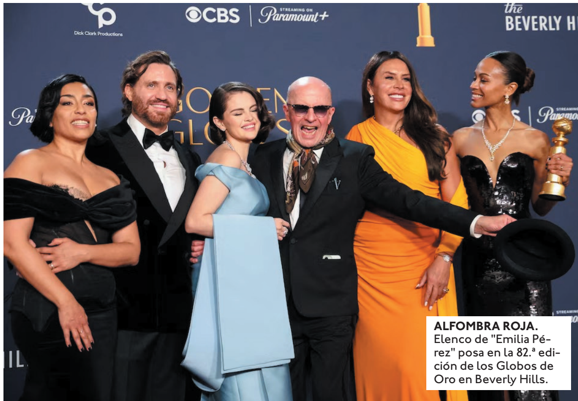
ALFOMBRA ROJA. Elenco de "Emilia Pérez" posa en la 82.ª edición de los Globos de Oro en Beverly Hills.

acento de Selena Gomez, quien es estadounidense de ascendencia mexicana pero no habla español.