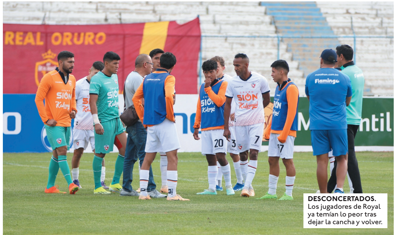
DESCONCERTADOS. Los jugadores de Royal ya temían lo peor tras dejar la cancha y volver.