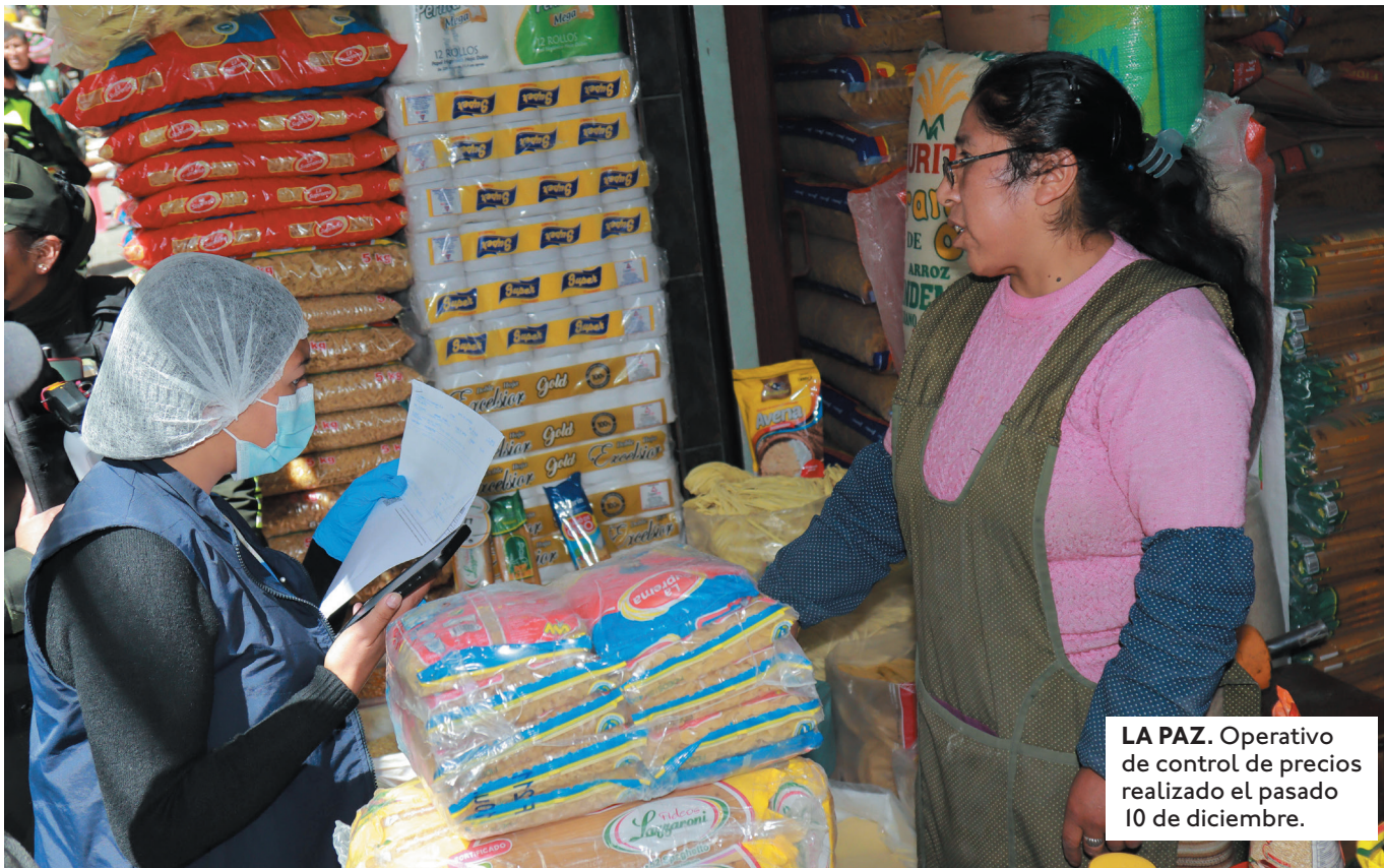
LA PAZ. Operativo de control de precios realizado el pasado 10 de diciembre.

EL INE ANALIZA 397 PRODUCTOS Y 424 VARIETADES. RECOPILO UNAS 54 MIL COTIZACIONES PARA ELABORAR EL ÍNDICE DE INFLACIÓN.