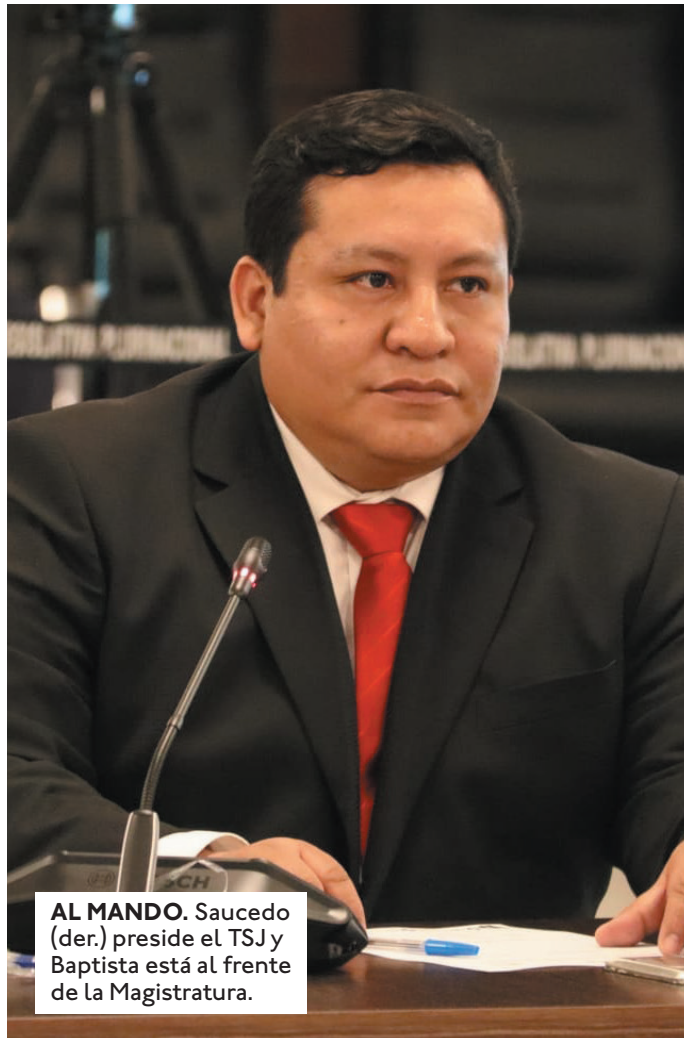
AL MANDO. Saucedo (der.) preside el TSJ y Baptista está al frente de la Magistratura.

“Es un joven cruceño que, si no me equivoco, ha sacado una de las votaciones más altas en la historia de los procesos de elecciones judiciales. Esperemos que como está ingresando con el apoyo del pueblo boliviano, de aquí a seis años, también se retire por la puerta grande”, señaló el ministro de Gobierno, Eduardo del Castillo, al felicitar, a través de sus redes sociales, a Saucedo por su elección en el TSJ. “Nosotros no queríamos imposiciones, nosotros queríamos que las decisiones se tomen de manera consensuada y eso ha logrado este