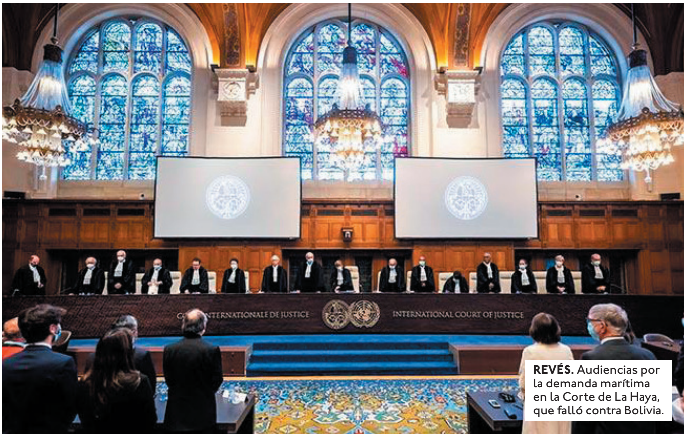
REVÉS. Audiencias por la demanda marítima en la Corte de La Haya, que falló contra Bolivia.

BOLIVIA PERDIÓ LAS DOS GRANDES DEMANDAS POR UNA SALIDA AL MAR Y LAS AGUAS DEL SILALA CON CHILE Y SON PROCESOS CON FALLOS DEFINITIVOS.